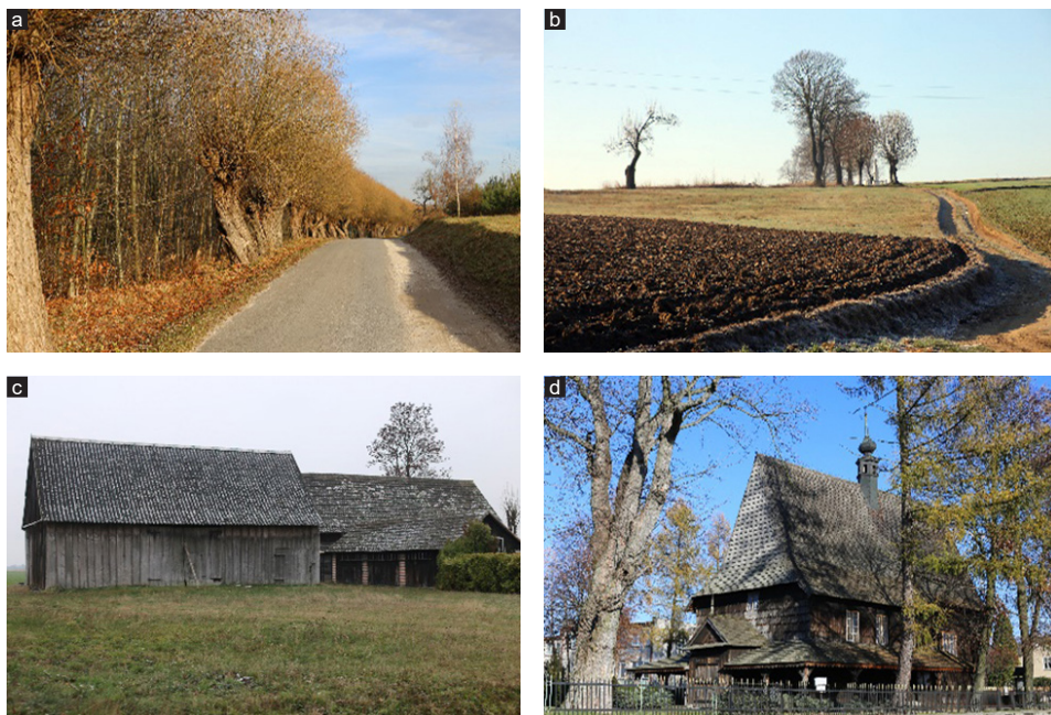
Ryc. 2. Przykłady istotnych walorów układów ruralistycznych a – Bąkowa Góra, strefa wejściowa do wsi, b – Chełmo, rami krajobrazowe widoczne ze środka wsi, c – Chróścín, zabudowa zagrodowa, d – Gidle, obiekty zabytkowe

Wśród najważniejszych walorów tych wsi należy wskazać zachowanie historycznych rysów układów przestrzennych siedliska. Wynika to przede wszystkim z braku zaawansowanych procesów rozwojowych w zakresie nowego budownictwa po II wojnie światowej oraz również w XXI w. Wsie te położone są głównie w peryferyjnych strefach województwa łódzkiego i nie były poddane intensywnym przekształceniom na skutek procesów urbanizacji i industrializacji. Wyróżnione jednostki osadnicze znajdują się w rejonach o charakterze depopulacyjnym, co oznacza stagnację lub częściową redukcję funkcji mieszkaniowej i zagrodowej (Dmochowska-Dudek 2020, Wójcik 2020). Zasadniczym problemem dla ochrony takich układów jest dysonans pomiędzy generalnie dobrym zachowaniem układu przestrzennego a degradacją walorów odnoszących się do elementów fizjonomicznych, w tym estetyki obiektów. Oparcie się w ochronie dziedzictwa kulturowego wyłącznie na walorach układu przestrzennego przy zmniejszających się zasobach tradycyjnej architektury i elementów towarzyszących prowadzi do braku czytelności uzasadnienia dla takich działań wśród decydentów i członków lokalnych wspólnot. Istotną kwestią jest również znalezienie sposobu na przekonanie właścicieli obiektów o dużych wartościach historycznych do ich zachowania