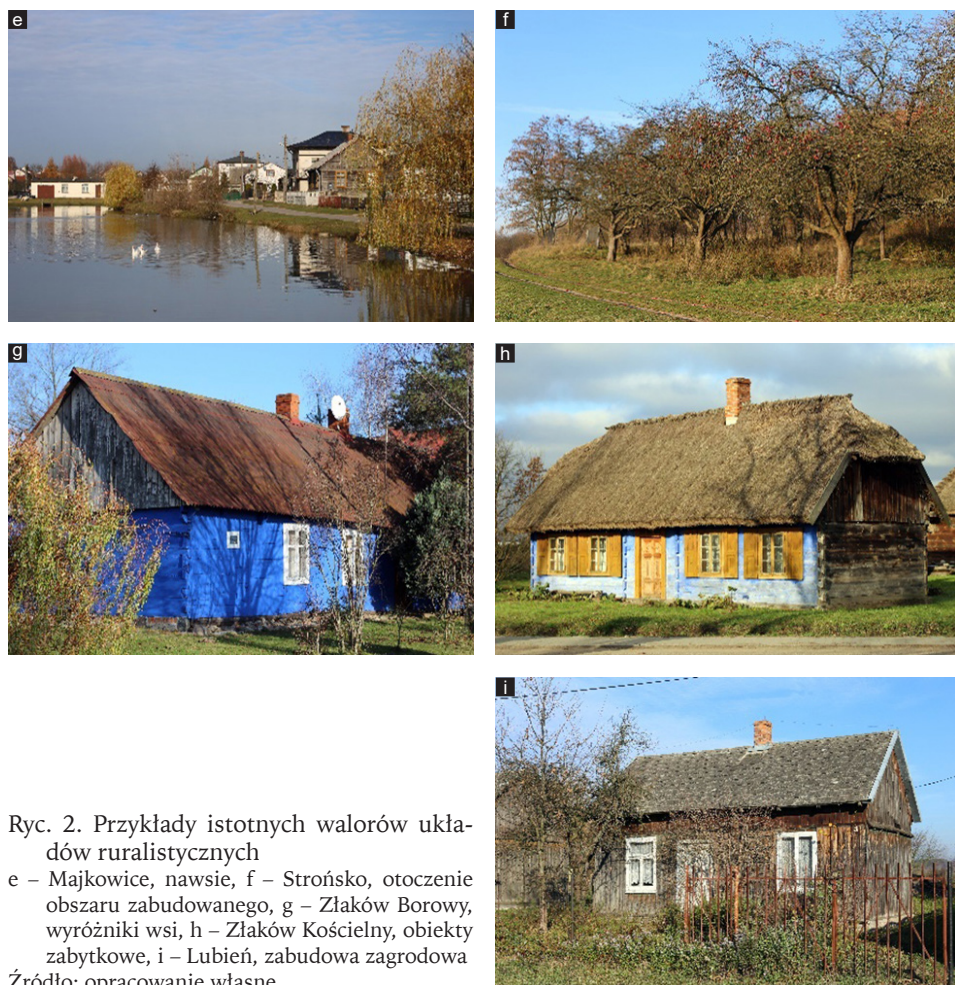
Ryc. 2. Przykłady istotnych walorów układów ruralistycznych

Warto zwrócić uwagę, że wśród aspektów poddanych ocenie (poza zachowaniem układu przestrzennego) najlepiej wypadły takie elementy, jak zachowanie funkcji użytkowych nawsia oraz otoczenie siedliska (por. ryc. 2). Walor utrzymania w dobrej kondycji przestrzeni wspólnej wynika nie tylko z potrzeb społecznych mieszkańców, ale również z inicjatyw w zakresie szeroko pojętych