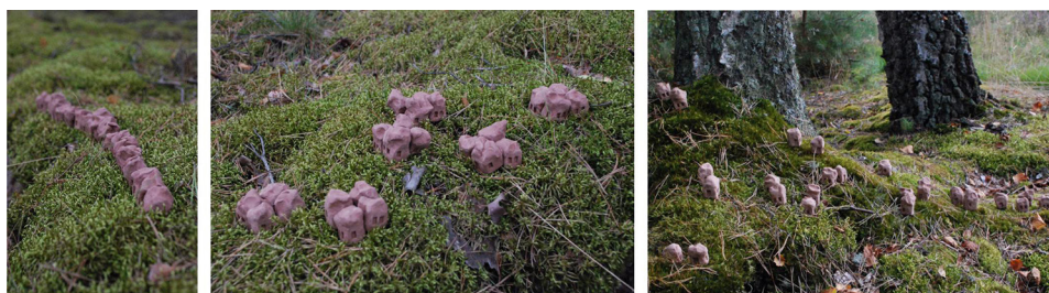
Ryc. 19. Wybrane przykłady według klasyfikacji kompozycyjnej

Trzecią metodą porządkowania i wskazywania typów rozwiązań jest podział w obrębie zrealizowanych działań pod kątem zawartości stworzonego układu form. Wówczas można podzielić przykłady na kompozycje spójne i rozproszone (ryc. 19). W tych pierwszych pojawiają się zgrupowania w obrębie konkretnego obszaru lub w oparciu o gęsto wypełnioną linię. Układy rozproszone z kolei można dzielić wtórnie w zależności np. od ilości kierunków, którymi posługuje się kompozycja. W klasyfikacji opartej na zasadach kompozycji można też przyjąć inne kryteria podziału, ale to konkretne wydaje się istotne z poziomu analizowanych cech.