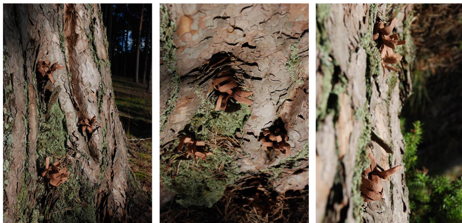
Ryc. 18. Lokowanie form zindywidualizowanych („B”) II