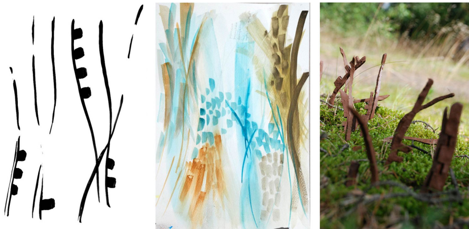
Ryc. 1. Wybrane elementy procesu w projekcie autorskim

Studium docelowych form zamieszkiwania oparto na obserwacjach przyrodniczych i próbie ich kulturowej transpozycji poprzez graficzny zarys, malarską ekspresję, rzeźbiarskie uformowanie i fotograficzne analizy sytuacyjne. Szkic – obraz – rzeźba – sytuowanie – fotografia to kolejne elementy procesu w autorskim projekcie opartym na badaniach i działaniach artystycznych (por. ryc. 1). Samo myślenie o ingerencji w przestrzeni można rozumieć jako początek istnienia obiektu architektonicznego. Sztuką jest tworzenie rysunku, modelowanie płaszczyzn i brył, całości dopełnia wiedza techniczna, pozwalając na fizyczne zaistnienie obiektu i jego właściwe doposażenie.