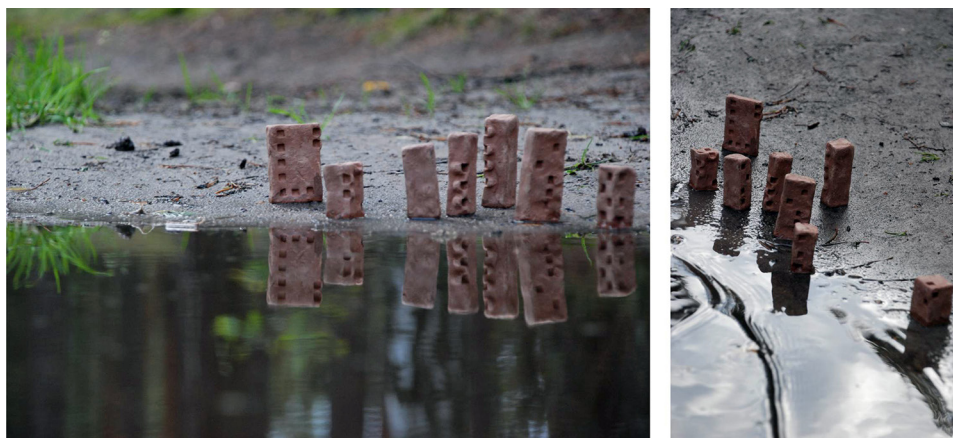
Ryc. 10. Badanie przestrzeni granicznych I Źródło: opracowanie własne.

Jako przykład eksploracji badawczo-twórczych przestrzeni granicznych można podać sprawdzanie lokowania na brzegu zbiornika wodnego, a nawet na skraju kałuży w lesie powstałej w wyniku obfitych opadów (ryc. 10–11).