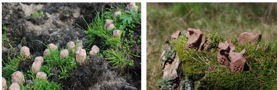
Ryc. 14. Wybrane przykłady według klasyfikacji pod kątem zindywidualizowania formy obiektów rzeźbiarskich (kolejno: typ „A”, typ „B”)

Drugi podział uwzględnia różne podejścia twórcze w metodzie. Można więc podzielić dotychczasowe efekty na dwie grupy: rozwiązania uzyskane poprzez formy schematyczne i te, w których zespół form to grupa rzeźb nieidentycznych, o unikalnym kształcie, ale stanowiących zbiór o jednorodnym charakterze formalnym (ryc. 14).