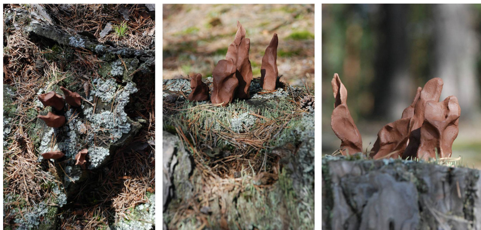
Ryc. 12. Rekompozycja z elementami biomorficznymi I Źródło: opracowanie własne.

Osobny zbiór tworzą działania z elementami biomorficznymi przekomponowanymi zastane miejsca w oparciu o analogie bioniczne (ryc. 12–13). Użyte w aranżacji formy powstały jako efekt autonomicznych refleksji na temat formy dopasowanej do przyrody zastanej. Efemeryczne obiekty nawiązują do kształtów. Powtarzają kierunki zastane, powielają zaobserwowane relacje formalne. Z takimi konotacjami wracają do miejsc składających się na zbiór doświadczeń twórcy.