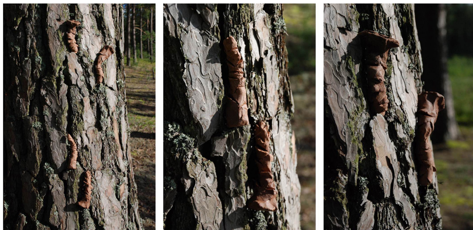
Ryc. 8. Wtopienie w otoczenie II

Wtopienie w otoczenie można realizować także poprzez upodobnienie form wprowadzanych do tych istniejących w przyrodzie, takich jak np. rośliny (żywe lub ich pozostałości), kamienie, gleba (ryc. 7–9). Podobieństwo wizualne pozwala na odbieraną wzrokowo asymilację. Działanie to wywiedzione jest ze zjawiska mimikry i dość powszechnie stosowane w obrębie bioniki. W tym projekcie, którego celem jest poszukiwanie sposobów i metod spasowania, sprawdziło się bardzo dobrze jako jeden z tropów.