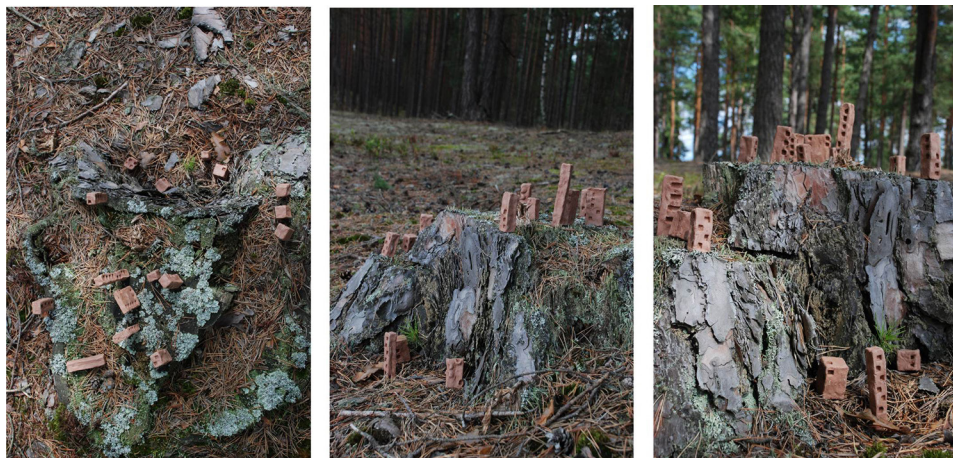
Ryc. 5. Podążanie za topografią I Źródło: opracowanie własne.

zniszczenia. Zmieniła obraz lasu, ale też obudziła refleksję o niepewności bezpieczeństwa w domach zbyt delikatnych wobec potęgi sił natury.