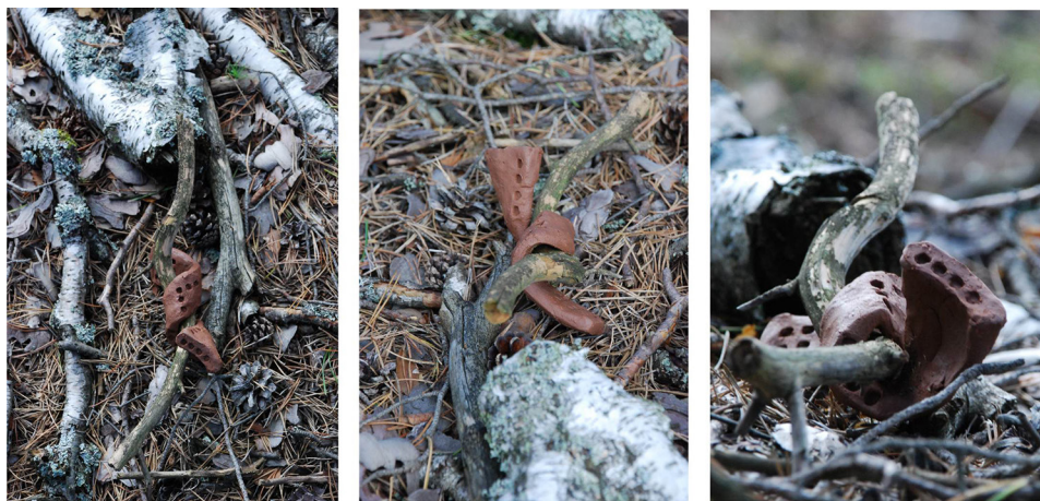
Ryc. 13. Rekompozycja z elementami biomorficznymi II

Autorskie rzeźby poszukują powinowactwa i źródła. Ukazują spasowanie, ale też niosą własną treść. Uzupełnione o przesłanie autorskie wnoszą wartości kulturowe, zmieniają wyraz i nastrój miejsca.