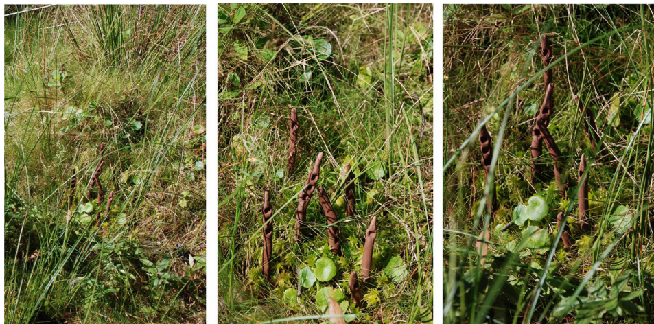
Ryc. 9. Wtopienie w otoczenie III