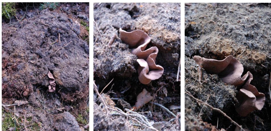
Ryc. 6. Podążanie za topografią II