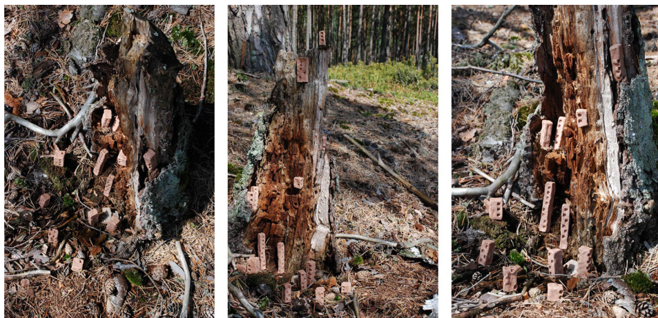
Ryc. 16. Lokowanie form schematycznych („A”) II