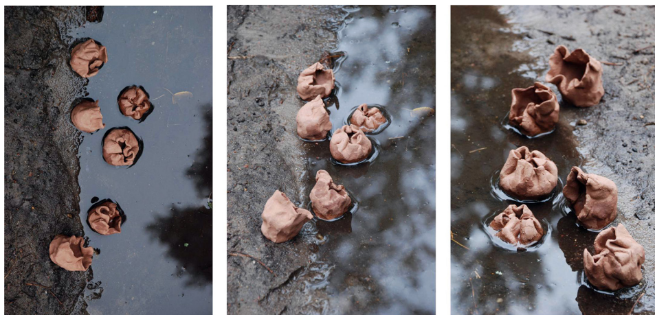
Ryc. 11. Badanie przestrzeni granicznych II