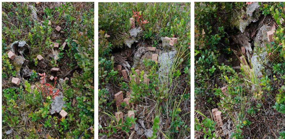
Ryc. 7. Wtopienie w otoczenie I Źródło: opracowanie własne.

Obiekty swoją skalą docelową musiałyby wyważyć proporcje część „zagłębionej” i wyniesionej ponad roślinność.