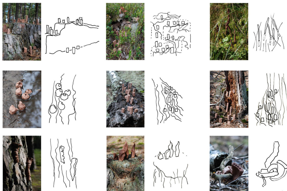
Ryc. 20. Szkice koncepcyjne potencjalnych układów urbanistycznych w oparciu o przeprowadzone badania – etap analiz, wybrane przykłady

należy zatem upatrywać nadziei na zrozumienie i podtrzymywanie idei kontynuacji tradycji regionalnej, niezależne od przyjętej strategii, każde ukierunkowane na kontynuowanie lokalnych wartości działanie jest wartościowe. Oczywiście wymarzone byłoby strategiczne planowanie i wdrażane sukcesywnie opracowane zespołowo schematy projektowe stanowiące ramowe podpowiedzi dla projektantów