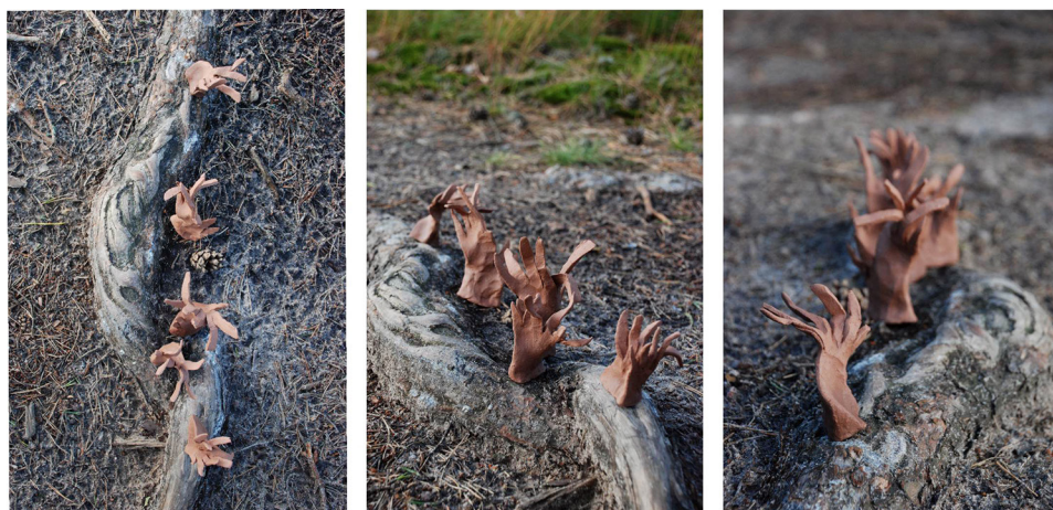
Ryc. 17. Lokowanie form zindywalizowanych („B”) I Źródło: opracowanie własne.

na inny poziom uszczegółowienia rozważań i dedykowanych wniosków. Wymaga innego wkładu zaangażowania. W nasuwających się wnioskach można podać, że pierwszy typ, jako narzędzie badawcze, pozwala skupić uwagę na przebiegu linii, umożliwia łatwe korekty w trakcie pracy nad aranżacją, pozostawia większe pole dla wyobraźni. Typ drugi, konkretyzując i angażując mocniej na tym etapie w uzyskanie zadowalającego efektu, tworzy kompozycję zamkniętą, pozwalając jednocześnie na wgłębienie się w konkretne walory uzyskanego efektu.