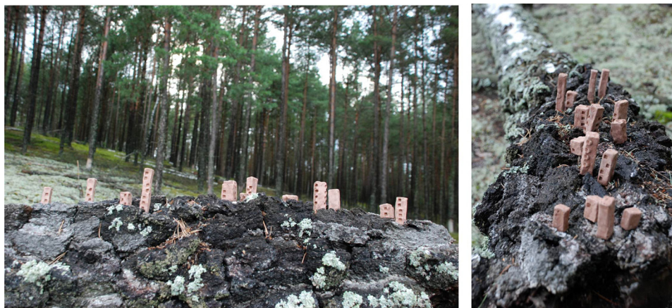
Ryc. 15. Lokowanie form schematycznych („A”) I Źródło: opracowanie własne.

W rozwiązaniach typu „A” pojawiają się formy schematyczne, podobne do siebie, nieposiadające cech mimikrycznych (upodobniających do otoczenia). Typ „B” posługuje się formami złożonymi o unikalnych kształtach, ale podobnych do siebie w poszczególnych zestawach.