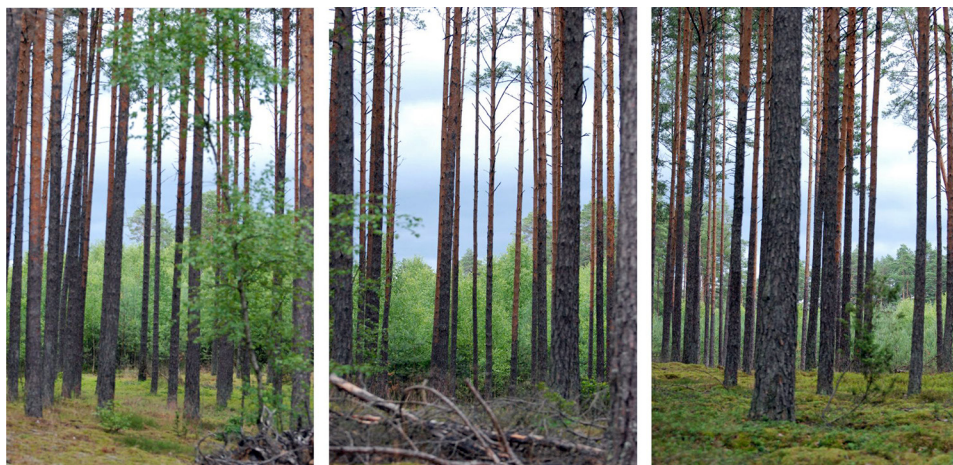
Ryc. 2. Wybrany przykład fotografii z kadrami krajobrazowymi – element analizy, Przytar- nia 2020

Wszystkie podjęte wątki przyniosły efekt spasowania i pozwoliły odkryć przebieg układów geometrycznych. Zauważono też duże podobieństwo w przebiegu tych śladów w różnych skalach. Fotografie z kadrami krajobrazowymi i malarskie próby plenerowe wyłoniły linie analogiczne do obserwowanych w poszyciu (ryc. 2–3). Wynika to zapewne po części z ogólnych praw fizyki i poruszania się w tej samej strefie klimatycznej (wpływ wiatru, mrozu, słońca) i geograficznej (budowa geologiczna, struktura gleby), ale pozwala pomyśleć o stworzeniu klasyfikacji tych sytuacji. Pojedyncze wzniesienia czy nakładające się ich serie mają przecież