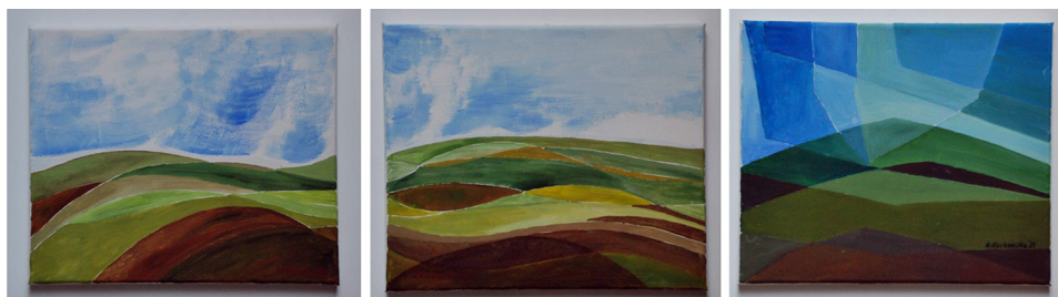
Ryc. 3. Wybrany przykład malarstwa plenerowego – element analizy, Joniny Wielkie 2020