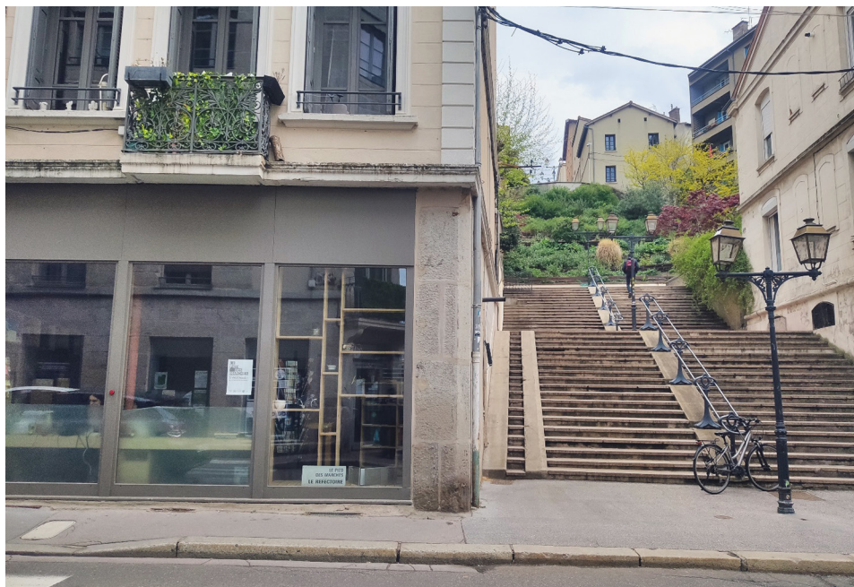
Fot. 4. Przykład poddanych renowacji przez stowarzyszenie RDD pustostanów handlowych na parterach kamienic w dzielnicy Crêt de Roch w Saint-Étienne (kwiecień 2021)