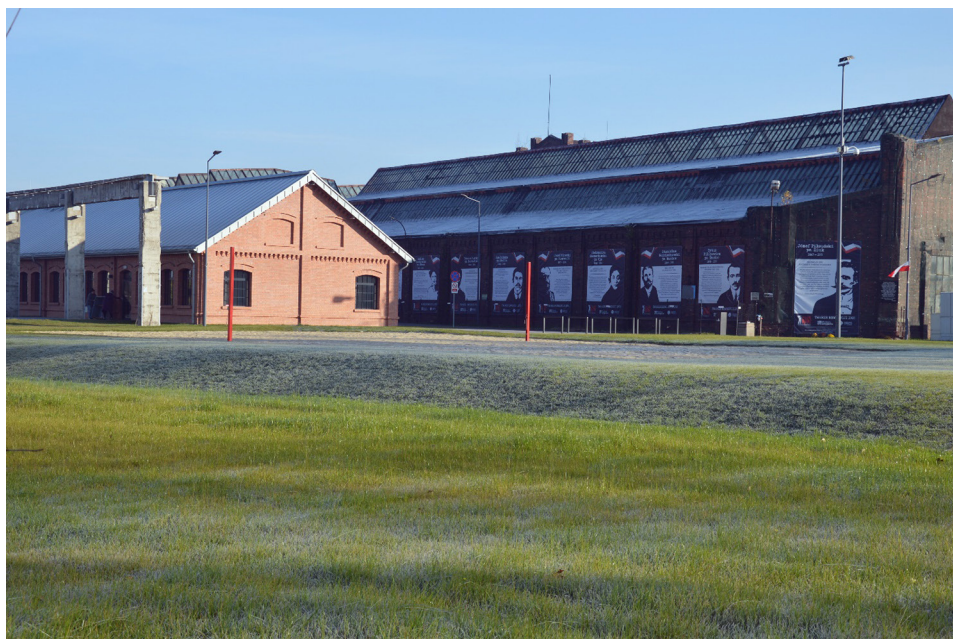
Fot. 1. Fragment kompleksu Fabryki Pełnej Życia. Po lewej wyremontowany i oddany do użytku budynek wielofunkcyjny (listopad 2020)

spółka miejska powołana do tego przedsięwzięcia. Przyszłość pokaże, czy Fabryka utrzyma swój społeczny klimat, czy stanie się przestrzenią skomercjalizowaną. Na razie stanowi dobry przykład miejsca innowacyjnego, otwartego na współpracę z różnymi podmiotami zarówno komercyjnymi, jak i społecznymi, prowadzącego rewitalizację centrum Dąbrowy Górniczej.