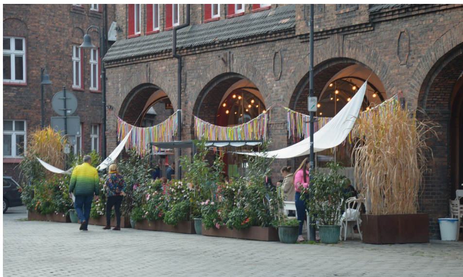
Fot 3. Nikiszowiec – fragment przestrzeni centralnej dzielnicy (listopad 2022)

W opisaną logikę wpisują się działania podjęte w katowickiej dzielnicy Nikiszowiec. Poważną rozmowę o konieczności zmian na Nikiszowcu zainicjowali lokalni liderzy, a rozgłos inicjatywie nadała regionalna redakcja „Gazety Wyborczej”. Symbolicznym momentem początku zmian w dzielnicy był rok 2008, w którym obchodzono jej 100-lecie, co stało się pretekstem do ożywienia działań na jej obszarze (Filove – nikiszowiec.com.pl ). Ich inicjatorem było Centrum Aktywności Lokalnej (jednostka współpracująca z Miejskim Ośrodkiem Pomocy Społecznej w Katowicach). W kolejnych latach z jednej strony znacznie zintensyfikowano działania oddolne związane z powołanym do życia stowarzyszeniem Fabryka Inicjatyw Lokalnych, a z drugiej Nikiszowiec został objęty miejskimi programami rewitalizacyjnymi. Programy te były skoncentrowane na renowacji