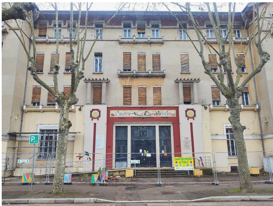
Fot. 2. Historyczny budynek Foyer Jeanne d'Arc z 1926 r. w Villeurbanne w trakcie renowacji, który będzie stanowił centrum nowej dzielnicy Autre Soie i jej swoiste „miejsce trzecie” (lutu 2021)

pracy w fabrykach jedwabiu. Budynek ten ma stanowić swoiste miejsce trzecie (Oldenburg 1989), czyli miejsce spotkań i wspólnych działań, ulokowane pośród nowych budynków mieszkaniowych, jakie powstaną w tym rejonie, z przeznaczeniem dla migrantów, osób bezdomnych, seniorów oraz studentów, a także osób zainteresowanych mieszkaniem w formule kooperatyw mieszkaniowych. Wspomniani operatorzy budownictwa socjalnego chcieli bowiem uzyskać przede wszystkim efekt zróżnicowania społecznego dzielnicy i solidarności mieszkańców budując niezwykle fragment miasta w inny sposób niż jest to przyjęte, tj. przy silnym zaangażowaniu obecnych i przyszłych mieszkańców miasta (w tym migrantów), wykorzystując niezwykle historię dzielnicy dla kreacji współczesnej tożsamości tego miejsca. Mając doświadczenie w budownictwie, ale nie w prowadzeniu szeroko zakrojonych projektów ze społecznością lokalną, GIE La Ville Autrement nawiązało bliską współpracę z działającym w Villeurbanne od 1963 r. stowarzyszeniem CCO, laboratorium innowacji społecznych i kulturalnych, które zbiegiem okoliczności poszukiwało akurat nowej siedziby. W ten sposób stowarzyszenie CCO zaangażowało się i niejako przejęło ster nad szerokim procesem społecznego projektowania „nowej jedwabnej dzielnicy” z silnym zaangażowaniem społeczności lokalnej, środowisk akademickich oraz lokalnej tkanki organizacji pozarządowych. Proces społecznego i fizycznego kreowania