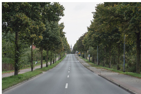
Fot. 12. Güstrow – historyczna aleja wjazdowa do miasta od strony widoku na zabytkową panoramę miasta stanowi zachowaną oś widokową

Dla zachowania widoku ważne jest odpowiednie zagospodarowanie przedpola ekspozycji. Jest to przestrzeń znajdująca się pomiędzy odbiorcą widoku a obserwowanym elementem, w tym przypadku panoramą. Wśród najważniejszych zabiegów służących do wyznaczenia oraz zachowania tego przedpola są dokładne analizy krajobrazowe, ale także odpowiednie planowanie i zarządzanie krajobrazem w tej przestrzeni. Wyniki analiz krajobrazowych uwzględnione w planowaniu przestrzeni mogą prowadzić do utrzymania niskiej zabudowy czy zieleni na tym terenie, wystrzegania się agresywnej kolorystyki, przyciągających wzrok obiektów budowlanych itp. Analizy krajobrazowe w tym przypadku to złożony zabieg wymagający wyznaczenia najwartościowszych widoków, ich kurtynowania itp. W miejscowości Grabow, dzięki uniknięciu lokowania nowej wysokiej zabudowy w miejscu dawnych terenów przemysłowych, zachowano widok panoramiczny na stare miasto ze znajdującego się w jego obrębie mostu. Warburg natomiast