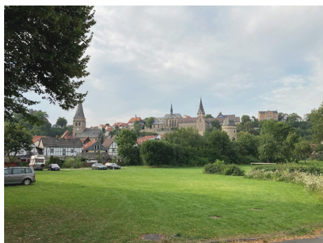
Fot. 13. Warburg – utrzymane przedpole ekspozycji najstarszej części miasta od strony południowej

Dla zachowania widoku ważne jest odpowiednie zagospodarowanie przedpola ekspozycji. Jest to przestrzeń znajdująca się pomiędzy odbiorcą widoku a obserwowanym elementem, w tym przypadku panoramą. Wśród najważniejszych zabiegów służących do wyznaczenia oraz zachowania tego przedpola są dokładne analizy krajobrazowe, ale także odpowiednie planowanie i zarządzanie krajobrazem w tej przestrzeni. Wyniki analiz krajobrazowych uwzględnione w planowaniu przestrzeni mogą prowadzić do utrzymania niskiej zabudowy czy zieleni na tym terenie, wystrzegania się agresywnej kolorystyki, przyciągających wzrok obiektów budowlanych itp. Analizy krajobrazowe w tym przypadku to złożony zabieg wymagający wyznaczenia najwartościowszych widoków, ich kurtynowania itp. W miejscowości Grabow, dzięki uniknięciu lokowania nowej wysokiej zabudowy w miejscu dawnych terenów przemysłowych, zachowano widok panoramiczny na stare miasto ze znajdującego się w jego obrębie mostu. Warburg natomiast