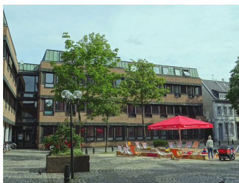
Fot. 6. Parchim – tymczasowe miejsce zabaw w centrum miasta w sąsiedztwie zabudowy usługowej

W centrach miast bardzo często brakuje przestrzeni na urządzenie placu zabaw. Można w tym celu stworzyć tymczasowe miejsca zabaw. Interesującym przykładem jest duża piaskownica z parasolem i kolorowe leżaki w mieście Parchim (fot. 6). Stworzona przestrzeń ma integracyjny charakter, jest dostępna dla dzieci, młodzieży i dorosłych. Stanowi inspirującą formę zabawy. Cała kompozycja jest bardzo barwna i dodaje swobodnego kolorytu istniejącemu wnętrzu urbanistycznemu.