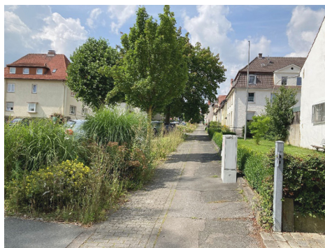
Fot. 10. Warburg – miejsca postojowe oddzielone od chodników za pomocą zieleni

Parchimer Altstadt 2019). Cechą charakterystyczną jest ograniczanie ilości sztucznego światła w godzinach po zmroku oraz stosowanie wielu gatunków, w tym uznawanych powszechnie za wiejskie bądź chwasty. Duży udział zieleni i powierzchni biologicznie czynnych występował również w przestrzeniach związanych z komunikacją drogową, takich jak miejsca postojowe czy parkingi (fot. 10). Wykorzystanie istniejącej wody w postaci rzek, stawów czy zbiorników wodnych w kompozycji publicznych terenów rekreacyjnych charakteryzuje się dużym udziałem zieleni oraz możliwości kontaktu z wodą (zejścia do wody, miejsca wypoczynkowe, renaturalizacja brzegów itp.).