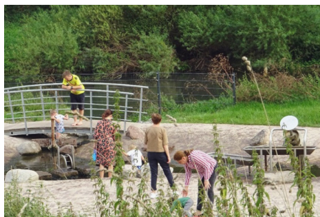
Fot. 2. Warburg – wodny plac zabaw nad rzeką Diemel