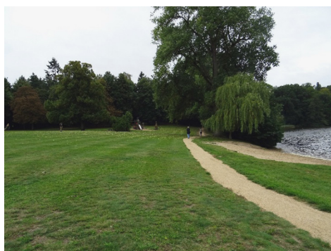
Fot. 4, 5. Parchim – plac zabaw o tematyce historycznej, zlokalizowany w przestrzeni parkowej nad Wockersee

zachęcają do spacerowania, a na placach zabaw mogą bawić się najmłodszy. To zróżnicowanie programowe sprzyja integracji mieszkańców, daje duże możliwości wyboru form rekreacji i wypoczynku, wpisując się w ideę kultury kształtowania przestrzeni miejskiej (fot. 3–5).