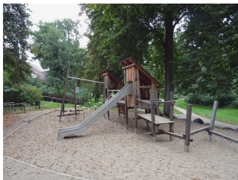
Fot. 3. Plac zabaw zlokalizowany w przestrzeni parkowej Parchimia