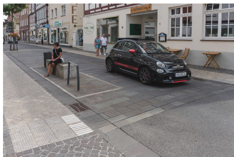
Fot. 1. Warburg – nawierzchnie spełniające cechy projektowania uniwersalnego

Wschodnią część miasta Parchim okalają obszary parkowe, które powstały na terenach dawnych fortyfikacji. Stały się one doskonałym miejscem rekreacyjnym dla mieszkańców. Poprzez odpowiednio dobrany program użytkowy z przestrzeni tej mogą korzystać mieszkańcy miasta w różnym wieku. Wytyczone aleje parkowe