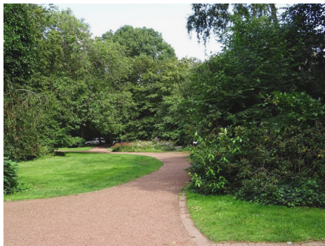
Fot. 7. Kempen – pierścieniowy park miejski w lokalizacji dawnych murów miejskich