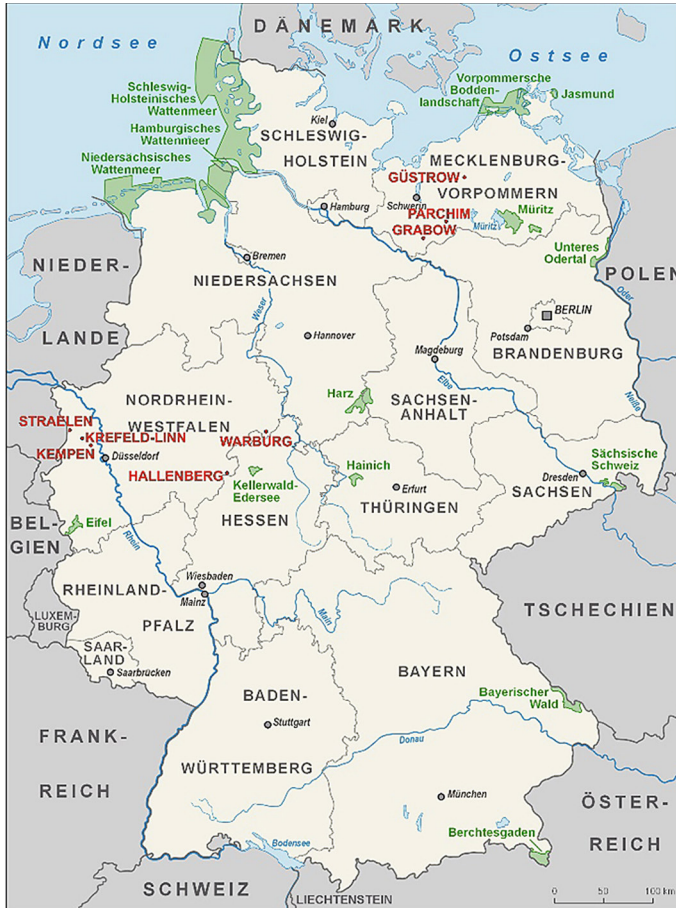
Ryc. 1. Lokalizacja analizowanych miast w Niemczech