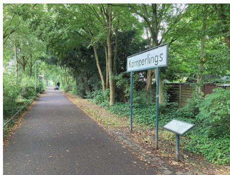
Fot. 8. Kempen – park liniowy po dawnej linii kolejowej

Kolejny cmentarz w tej miejscowości – Neuer Friedhof – zlokalizowany jest w północno-wschodniej części miasta i połączony z linią brzegową Wockersee. Został zaprojektowany przez architekta Wernera Cords-Parchima i założony w latach 20. XX w., rozbudowany w latach późniejszych. Część historyczna została uznana za wzorcową i wpisana na listę zabytków powiatu Ludwigslust-Parchim. Na jego obszarze znajdują się cmentarze wojenne, groby honorowych obywateli Parchimia czy pomnik żydowski. Teren o powierzchni powyżej 13 ha jest