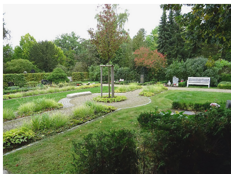
Fot. 9. Parchim – fragment Neuer Friedhof