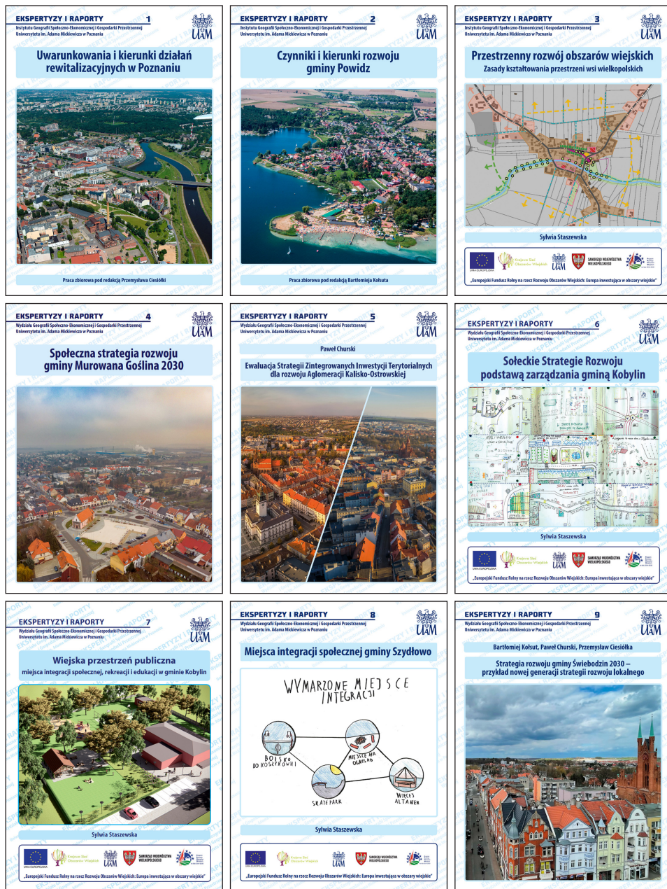
Ryc. 1. Prace z serii Ekspertyzy i Raporty Wydziału Geografii Społeczno-Ekonomicznej i Gospodarki Przestrzennej Uniwersytetu im. Adama Mickiewicza w Poznaniu – PrtScn stron tytułowych