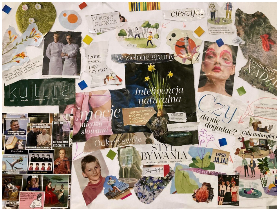
Ryc. 2. Plakat grupy 3 – kolaż przedstawiający wizję przyszłości ul. św. Marcin w Poznaniu Źródło: warsztaty z interesariuszami ul. św. Marcin (Poznań, 28.05.2024).

bardziej szczegółowo zdefiniowanych, niezbędnych do wdrożenia instrumentów, projektów i działań.