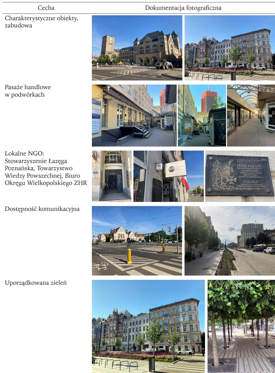
Tabela 2. Ilustracja wybranych mocnych stron obszaru badań