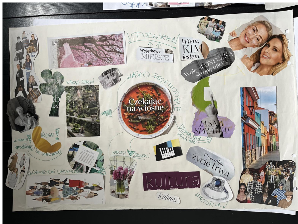
Ryc. 1. Plakat grupy 2 – kolaż przedstawiający wizję przyszłości ul. św. Marcin w Poznaniu Źródło: warsztaty z interesariuszami ul. św. Marcin (Poznań, 28.05.2024).

lokalnych podwojek i pasaży jako przestrzeni mogących uzupełniać aktywności głównej przestrzeni publicznej, jaką jest ul. św. Marcin.