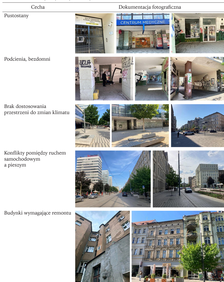
Tabela 4. Ilustracja wybranych słabych stron obszaru badań