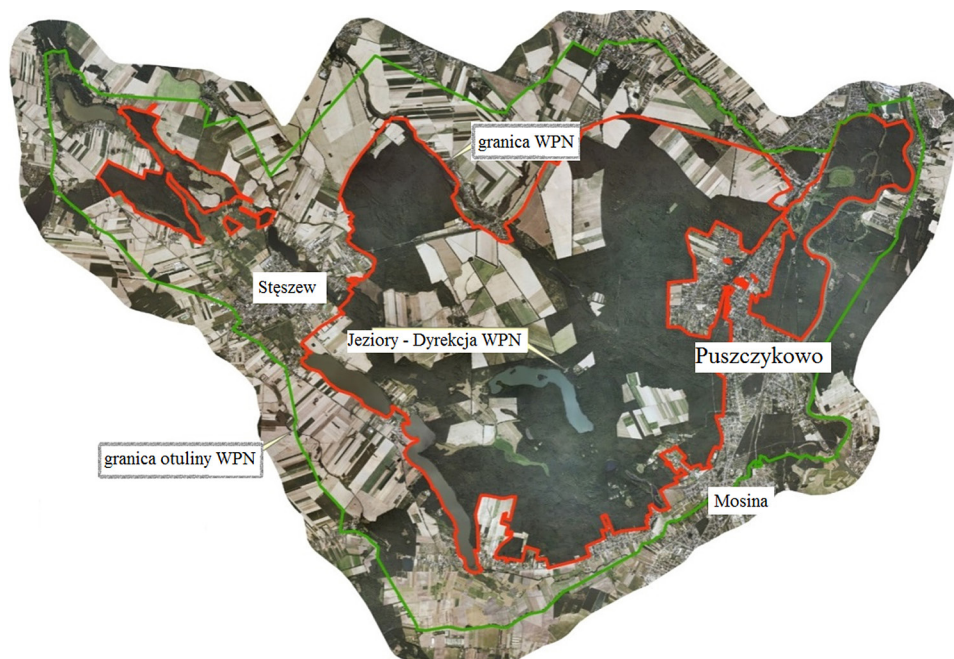
Ryc. 1. Położenie Puszczykowa w otulinie Wielkopolskiego Parku Narodowego

grupa powyżej 56 roku życia. Opinie zostały zebrane za pośrednictwem Internetu (54%) i kwestionariuszy pozostawionych w miejscach użyteczności publicznej, takich jak sklepy (18%), szkoły (16%), urząd miasta (12%).