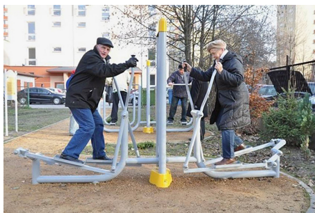
Ryc. 1. Częstochowski park ćwiczeń dla seniorów

Interesujących przykładów budownictwa dedykowanego seniorom, a zarazem inteligentnej gospodarki i życia, można znaleźć na rynku deweloperskim w krajach Grupy Wyszehradzkiej wiele. Branża deweloperska oraz organizacje wyspecjalizowane w opiece nad osobami starszymi dostrzegają potencjał rynku tkwiący w najstarszej części społeczeństwa (Kirejczyk i in. 2015). Wartościowym rozwiązaniem zgodnym w pełni z ideą miasta przyjaznego starzeniu się jest budynek gminy żydowskiej w Pradze, w Republice Czeskiej (ryc. 2; dzielnica Vinohrady; DSP Hagibor 2015). W sąsiedztwie starego ratusza z 1911 r., cennego również pod względem historycznym, wybudowano i oddano do użytku w 2008 r. nowoczesny kompleks dysponujący ponad 100 miejscami dla osób starszych pochodzenia żydowskiego. W budynku zamieszkują nie tylko osoby wymagające profesjonalnego wsparcia rehabilitacyjnego, lecz i pełnosprawni seniorzy. Obiekt otrzymał międzynarodowe wyróżnienia ze względu na funkcjonalność, oryginalną architekturę oraz nowatorskie rozwiązania. Nowy budynek zintegrowany ze starym ratuszem żydowskim