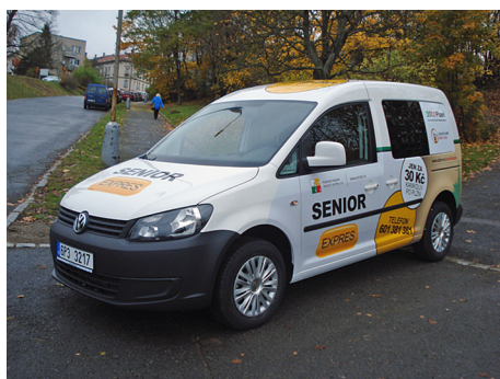
Ryc. 3. Senior taxi Pilzno (Republika Czeska)

Źródło: http://www.plzen.eu/obcan/aktuality/z-mesta/o-službu-senior-expres-je-zajem.aspx .