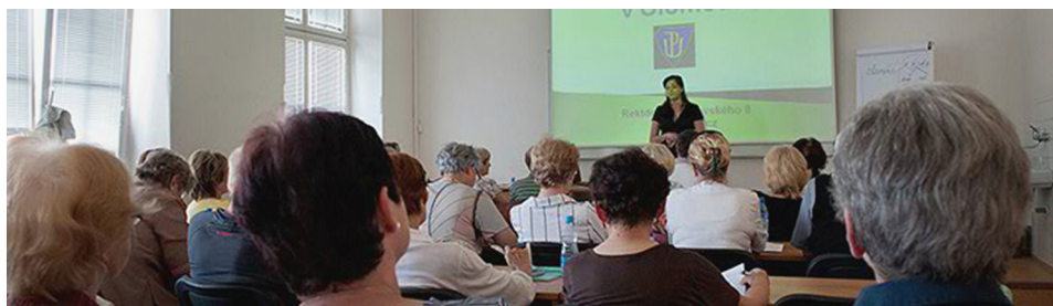
Ryc. 4. Uniwersytet III Wieku w Ołomuńcu (pierwszy UTW w Republice Czeskiej) – przykłady

Według definicji WHO miasta przyjazne starzeniu się powinny sprzyjać integracji społecznej. Jednym z modelowych przykładów w tej dziedzinie są banki czasu zakładane przez organizacje pozarządowe oraz miejskie ośrodki pomocy społecznej. Przykładowo Bank Czasu Seniora w Częstochowie pozwala na wymianę „godzin pracy” pomiędzy uczestnikami banku w postaci np. wzajemnego świadczenia sobie różnorodnych usług, takich jak chociażby wyprowadzenie psa w czasie choro-