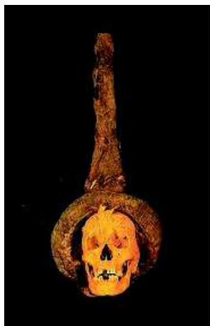
A. Subeshi (Xinjiang, Chiny), http://califia.us/tarim/witcheshat/witch1.htm , dostęp: 03.09.2014