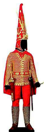
A. Tzw. „złoty człowiek” z kurhanu Issyk w południowo-wschodnim Kazachstanie, http://www.csen.org/WomenWarriors/Statuses_Women_Warriors.html , dostęp: 03.09.2014.