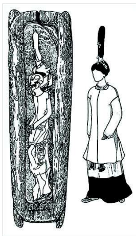
B. Ukok (Ałtaj, Rosja), http://knpradziejowe.wordpress.com/2013/03/22/tajemnice-syberyjskiej-ksiezniczki/ , dostęp: 03.09.2014