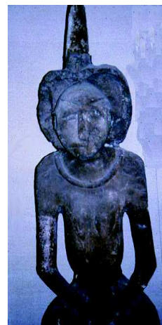
C. Połowiecka „baba kamienna”. Okolice Tanais (Rostów, Rosja), http://www.csen.org/WomenWarriors/Statuses_Women_Warriors.html , dostęp: 03.09.2014.