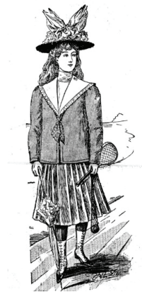
Ilustracja 5 - 7. Kostium dla dziewczynki, „Mody Paryskie” 1899, nr 18, s. 5; Sukienka dla dziewczynki, w: tamże, s. 2; Sukienka dla dziewczynki, w: tamże

Trzecia panienka wybiera się pograć w tenisa, ponieważ przedstawiono ją z rakiętą i piłką w siatce. Grafiki te pozwalają badaczowi nie tylko poznać specyfikę ubiorów dziecięcych ostatniej dekady XIX wieku, ale też zabaw i zabawek oraz rozrywek dziewczęcych w tym okresie. Oczywiście, w wielu innych czasopismach także znajdujemy szereg rycin prezentujących mody dziecięce (np. ilustr. 8 i 9).