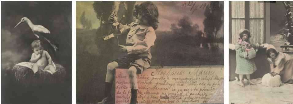
Ilustracja 24 - 26. Pocztówki okolicznościowe – z okazji narodzin dziecka, „neutralne” prezentujące sceny zabawy dziecięcej; od lewej: odbitka na papierze srebrzo-żelatynowym, przed 1924; pocztówka, 1908; pocztówka okolicznościowa, odbitka na papierze srebrzo-żelatynowym, przed 1908