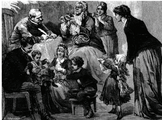
Ilustracja 4. Wicie wianków na Boże Ciało , „Kłosy” 1878, nr 677, s. 392-393

Widać wyraźnie zaangażowanie piątki dzieci w różnym wieku w przygotowanie do obchodów Bożego Ciała, które wspólnie z pozostałymi domownikami (ojcem, matką, babcią i być może guwernantką) przygotowują świąteczne wianuszki.