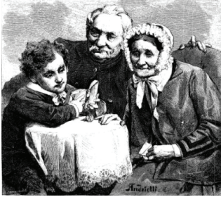
Ilustracja 3. Z życia dworu wiejskiego. Wieczór literacki , „Kłosy” 1875, nr 534, s. 193

Kolejna grafika z serii ukazuje wieczorne czytanie książki dziadkom przez wnuczka.