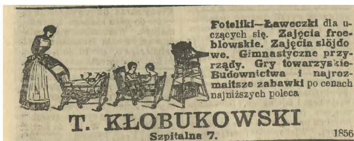
Ilustracja 12. Reklama sprzętów i zabawek dziecięcych, „Kurier Warszawski” 1909, nr 350, s. 35