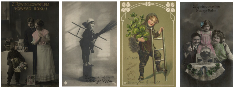
Ilustracja 30 - 33. Pocztyówki okolicznościowe - z powinszowaniem Nowego Roku, od lewej: odbitka na papierze srebrzo-żelatynowym, po 1900; odbitka na papierze żelatynowo-bromosrebrzym, przed 1919; pocztówka, 1907; odbitka na papierze srebrzo-żelatynowym, po 1900, Biblioteka Narodowa POLONA, domena publiczna