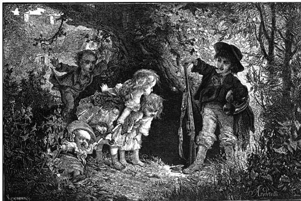
Ilustracja 2. Z życia dworu wiejskiego. Młody myśliwy, „Kłosy” 1872, nr 372, s. 104-105

W ogrodzie pobliskim dworu, najstarsze pacholę, z wrodzonym popędem do myślistwa, przewiesiwszy torbę i trąbkę myśliwską poszło na ptaszki ze swoją małą strzelbą. Strzał mu się udał, bo drobną ptaszynę, która się łatwo podejść mu dała, pozbawił życia. Spadła z gałązki, a na huk strzelby całe rodzeństwo zbiegło się w tę stronę, w której mały myśliwiec z dumą i radością stoi w zamaszystej postawie, wsparty jedną ręką na zabójczej broni, drugą opierając na niezwykle do jego wzrostu wielkiej trąbce łowieckiej, której ojciec polując z ogarami używa. Pierwszy to strzał mu się udał i pierwszy łup myśliwski. Nadbiegłe dziewczynki przypatrują się chciwie drobnej zwierzynie, młodsza bez obawy z niezwykłą ciekawością, starsza ciągnie za rękę najmniejszego braciszka, co się opiera i z przestrachu krzyczy, pochyla się ale z pewną obawą, bo pierwszy raz widzi z bliska drgającą jeszcze ptaszynę, i pierwsza rozbudzona myśl o śmierci ją przeraża. Za nimi młodszy brat pędzi co siła ze dworu, z okrzykiem, z rozkrzyżowanymi