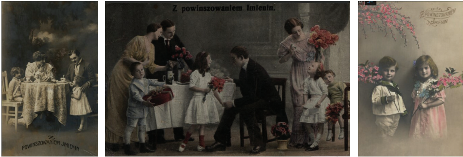
Ilustracja 27 - 29. Pocztyówki okolicznościowe - z powinszowaniem imienin, od lewej: odbitka na papierze srebrzo-żelatynowym, 1900; druk barwny, po 1900; odbitka na papierze srebrzo-żelatynowym, przed 1914