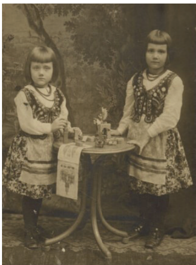
Ilustracja 44. Portret niezidentyfikowanych dziewczynek, Kraków 1894 r., fotografia gabinetowa

Fotografia plenerowa przedstawia kilkunastoletnią dziewczynkę w jasnej sukience, pchającą wózek z małym chłopcem. Prosty wózek na dużych, metalowych kołach służył do sprawnego przemieszczania się z dzieckiem po ścieżkach parkowych czy drogach. Przy wózku stoi piastunka, którą w badanym okresie zatrudniano w zamożnych rodzinach do opieki i pielęgnacji małych dzieci. Piastunki najczęściej wywodziły się z niższych warstw społecznych. O niskim statusie społecznym niani świadczyć może fakt, iż na zdjęciu nie ma obuwia.