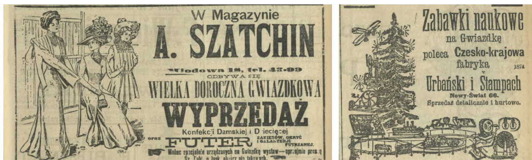
Ilustracja 10, 11. Reklama wyprzedaży konfekcji damskiej i dziecięcej, „Kurier Warszawski” 1909, nr 350, s. 29; Reklama zabawek naukowych, „Kurier Warszawski” 1909, nr 350, s. 27

ki dla niemowląt i starszych dzieci reklamowano, zamieszczając obok opisu towaru jego cenę, miejsce sprzedaży, czy firmę produkującą, także grafikę go prezentującą, lub nawiązującą do specyfiki towaru. Szczególnie wiele reklam ukazywało się w okresie poprzedzającym Boże Narodzenie, kiedy adresowane dla dzieci towary często znajdowały swoje miejsce pod choinką. Jako przykład otworzymy jeden z przedświątecznych numerów „Kuriera Warszawskiego” z 1909 roku. Znajdziemy tam reklamy urozmaicone ilustracjami – zarówno odzieży dziecięcej, zabawek (szczególnie popularnych na początku XX wieku zabawek naukowych, z wykorzystaniem elektryczności i telefonu), jak i sprzętów dzieciennych (wózków, stolików i krzesełek, przyrządów gimnastycznych oraz zabawek i zajęć froeblovskich, słojdowych, gier towarzyskich, budownictw drewnianych – ilustr. 10 - 12). Także w wielu innych czasopismach, w których zamieszczano działy, strony lub dodatki reklamowe, można odnaleźć reklamy towarów adresowanych dla dzieci lub wykorzystujących dziecięcę wizerunki (ilustr. 13 - 15).