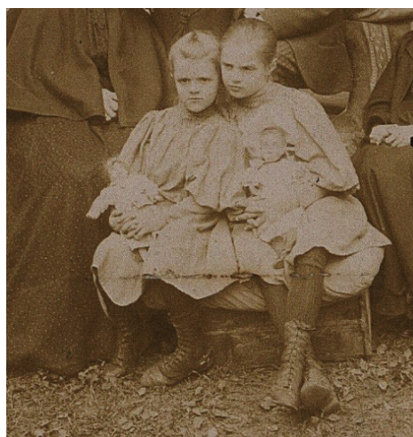
Ilustracja 42. Portret rodzinny Zahorskich w ogrodzie przed domem w Birsztatnach (Litwa, okręg kowieński), 1898 r., fotografia plenerowa, Biblioteka Narodowa POLONA, domena publiczna

Troje dzieci – dziewczynka i chłopiec pozują z bliskimi do rodzinnej fotografii plenerowej. Widoczne na pierwszym planie dziewczynki ubrane są w jednakowe sukienki, rajstopy oraz wysokie buciki. Obie w ramionach trzymają lalki (ilustr. 42).