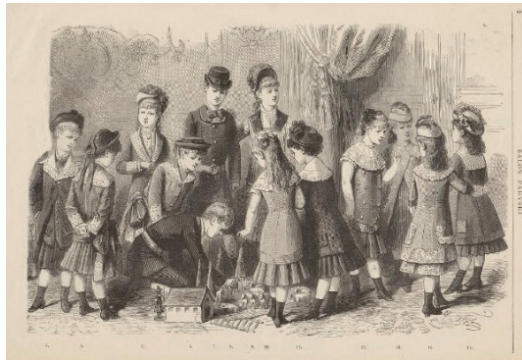
Ilustracja 8, 9. Ubranie dla dziewczynki i chłopczyka, „Bazar. Tygodnik mód i robót ręcznych” 1965, nr 2, s. 9. (opis ryciny, s. III); Wzory ubiorów dziecięcych, „Salon Paryski” 1879, nr 1, s. 2