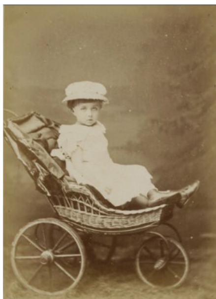
Ilustracja 47. Portret niezidentyfikowanej dziewczynki, Warszawa 1876 r., Jan Mieczkowski, odbitka na papierze aluminiowym, Biblioteka Narodowa POLONA, domena publiczna

Kilkuletnia dziewczynka, pozująca w wiklinowym spacerowym wózku dziecięcym, ubrana jest w białą, lekką sukienkę i kapelusik oraz krótkie półbuciki. Wózek wykonany z wikliny ma metalowe koła i charakterystyczną rozkładaną skórzaną budę, chroniącą od słońca czy deszczu (ilustr. 47).