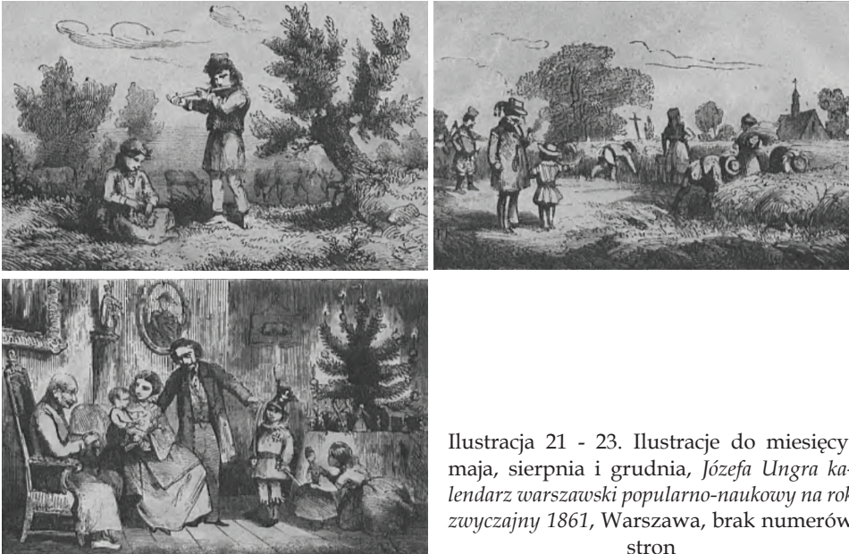
Ilustracja 21 - 23. Ilustracje do miesięcy: maja, sierpnia i grudnia; Józefa Ungra kalendarz warszawski popularno-naukowy na rok zwyczajny 1861 , Warszawa, brak numerów stron

nę rodzinnego wieczoru, kiedy po wieczerzy wigilijnej senior rodu i rodzice z trójką dzieci spędzają wspólny czas przy roziskrzonej choince. Kilkuletnia dziewczynka bawi się dużą lalką, którą z pewnością znalazła wśród wielu podarków pod choinką, chłopiec przebrał się już w otrzymany strój żołnierza i prezentuje go zebrany. Najmłodsze dziecko przygląda się zabawie rodzzeństwa trzymane w ramionach przez matkę (ilustr. 21 - 23).