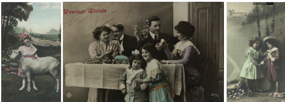
Ilustracja 37 - 39. Pocztówki okolicznościowe – Wesołego Alleluja, od lewej: reprodukcja, pieczętka na awersie, przed 1910; odbitka na papierze srebrowo-żelatynowym, po 1900; odbitka na papierze srebrowo-żelatynowym, przed 1912

Wartości poznawcze pocztówek dla badania dziecięcego świata są zbieżne z większością prezentowanych tu materiałów ikonograficznych – odzwierciedlają charakterystyczne dla danego okresu historycznego ubiory dziecięce, fryzury, sprzęty, zabawki, a nawet pewne formy aktywności, zachowań, bądź relacji rodzinnych. Dostrzec można wykorzystywanie dziecięcych wizerunków do personifikacji świątecznych postaci – na przykład aniołka przynoszącego gwiazdkę (choinkę i upominki świąteczne – ilustr. 36), czy Nowego Roku – dziecka niosącego szczodre dary (ilustr. 30). Dziecko (zwykle chłopca) przedstawiano też często w postaci kominiarczyka przynoszącego szczęście na cały kolejny rok (ilustr. 31, 32). Pamiętać jednak należy, iż część pocztówek okolicznościowych stanowiły odbitki pochodzące z zagranicznych drukarni, opatrywane jedynie napisami w języku polskim, stąd istotne jest sprawdzenie ich pochodzenia.