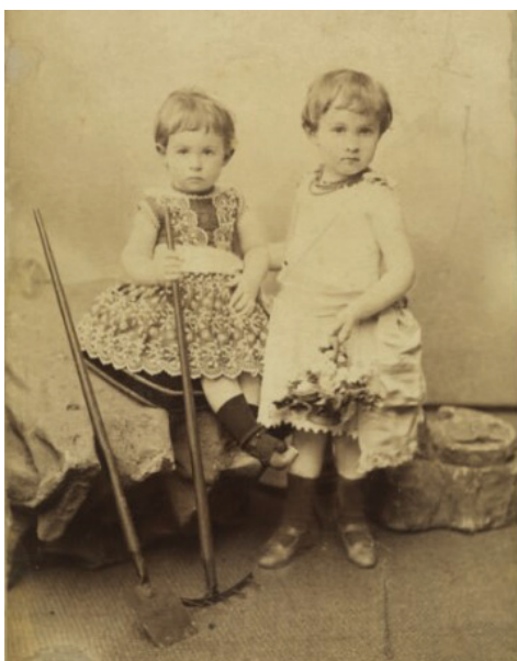
Ilustracja 46. Portret niezidentyfikowanych dziewczynek, 1870 r., Warszawa, atelier W. Twardzickiego, fotografia gabinetowa, Biblioteka Narodowa POLONA, domena publiczna

W atelier fotograficznym sfotografowano dwie kilkuletnie dziewczynki, ubrane w letnie sukienki, ciemne skarpetki i lekkie buciki. Ciekawostką są dzieciinne narzędzia ogrodnicze, które popularne w badanym okresie, służyły (obok łopatek i wiaderek) do zabaw w ogrodzie, ale też do podstaw nauki ogrodnictwa (ilustr. 46).