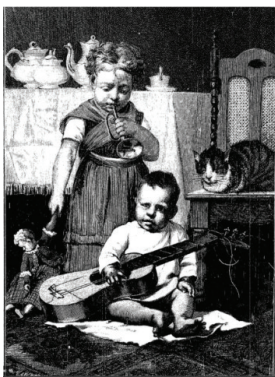
Ilustracja 1. Z życia dworu wiejskiego. Orkiestra domowa, „Kłosy. Pismo ilustrowane tygodniowe”, 1874, nr 466, s. 354

ikonograficzny odczytywany jest jak dokumentacja rzeczywistego świata.