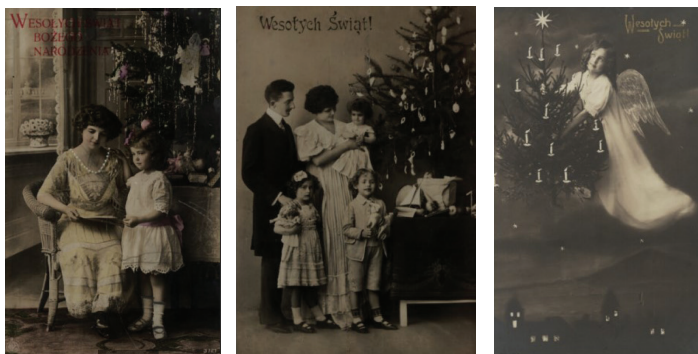
Ilustracja 34 - 36. Pocztyówki okolicznościowe - Wesołych Świąt Bożego Narodzenia, od lewej: odbitka na papierze srebrzo-żelatynowym, po 1900; odbitka na papierze srebrzo-żelatynowym, przed 1918; odbitka na papierze srebrzo-żelatynowym, przed 1909, Biblioteka Narodowa POLONA, domena publiczna