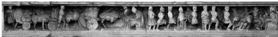
Il. 1. Łuk Septymiusza Sewera w Rzymie, fragment fryzu nad przejściami bocznymi, III NW