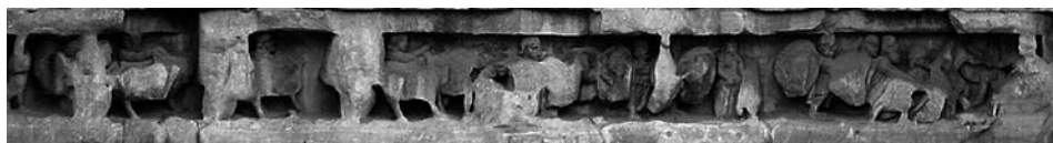
Il. 2. Łuk Septymiusza Sewera w Rzymie, fragment fryzu nad przejściami bocznymi, IV SW

lub bardziej symbolicznych obrazach oddać miał wielkość Septymiusza Sewera i jego rodu oraz podsumowywać jego dokonania całej dekady. Szczyt Łuku zwieńczono grupą posągów, która dzisiaj już niezachowana, znana jest tylko z wizerunków na monetach. Niektóre ukazują na attyce władcę w sześciokonnym wozie ( sexiga ) oraz towarzyszących mu jeźdźców 4 , natomiast inne pokazują wariant uzupełniony o postacie dwóch pieszych (żołnierzy rzymskich czy jeńców?) 5 . Z kolei reliefy na cokołach, podtrzymujących wspomniane kolumny, wyobrażają żołnierzy rzymskich prowadzących jeńców partyjskich 6 . W płaskorzeźbach czterech głównych płyt głównych nad bocznymi arkadami podjęto w kilkunastu odsłonach temat wojen partyjskich, toczonych od 195 roku aż po zdobycie Ktezyfontu w 198 roku i utworzenie prowincji Mezopotamii 7 . Deko-