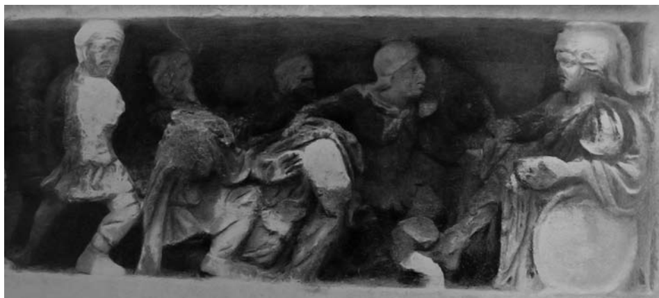
Il. 4a. Łuk Septymiusza Sewera w Rzymie, fragment fryzu nad przejściami bocznymi, III NW

postawa i gesty. Zamyka ten obraz kilkupostaciowa scena, odróżniająca się swą organizacją od grupy jeńców. Oto pięcioro Partów w służalczych pozach korczy się przed upersonifikowaną Romą. Dwóch z nich nawet klęczy, a jakkolwiek reliefy częściowo są już bardzo uszkodzone, rozpoznać można przynajmniej na jednym fragmencie rękę klęczącego wyciągniętą w geście zapewne błagalnym. Wiele się dzieje w tej części przedstawienia. Cała prawa strona reliefu nacechowana jest dynamiką — pomimo niemalże hieratycznej postawy jednego z kroczących jeńców — ekspresją, zaakcentowaną gestami klęczących Partów, a także tragizmem, podkreślonym przez wyraziste (co zauważyć można mimo erozji reliefu) twarze kobiet partyjskich i wymowę ich gestów.