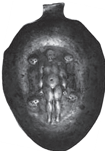
Ryc. 3. Unikatowa srebrna chochła do rytualnego obmywania zwłok z 1707 r. Za: L. Dulik, W. Gołec, Jerozolima Królestwa Polskiego. Opowieść o żydowskim Lublinie , Lublin 2008, zdjęcie 59