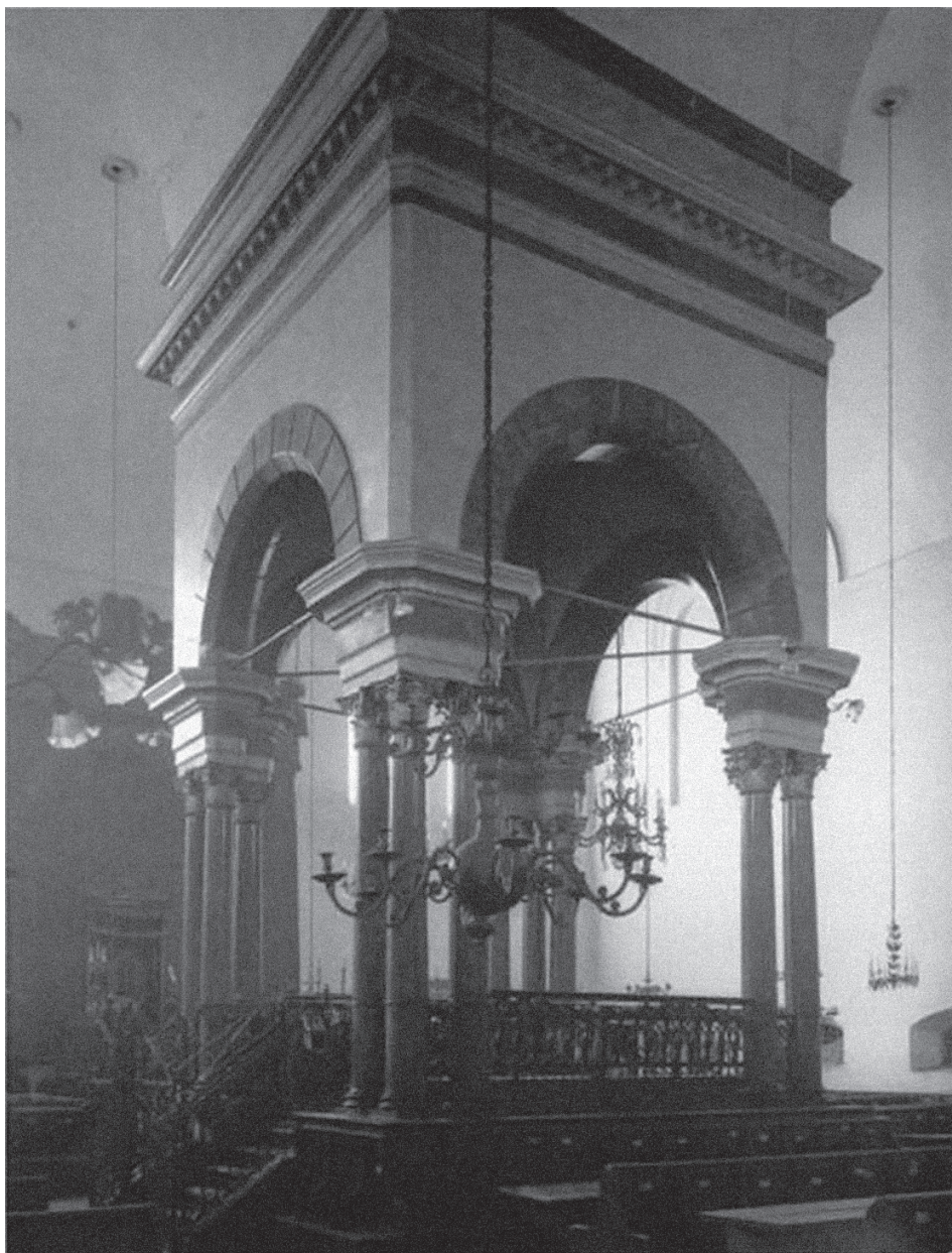
Ryc. 1. Bima-almemor w Wielkiej Synagodze. Za: L. Dulik, W. Golec, Jerozolima Królestwa Polskiego. Opowieść o żydowskim Lublinie, Lublin 2008, zdjęcie 52