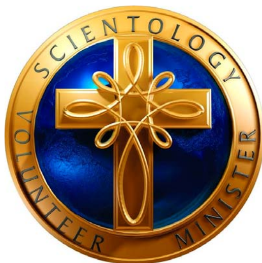
Il. 1. Logo Volunteer Ministers