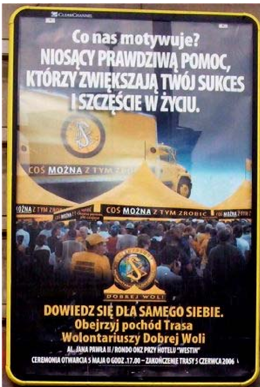
Il. 3. Tablica reklamowa VM przy ul. Waryńskiego w Warszawie