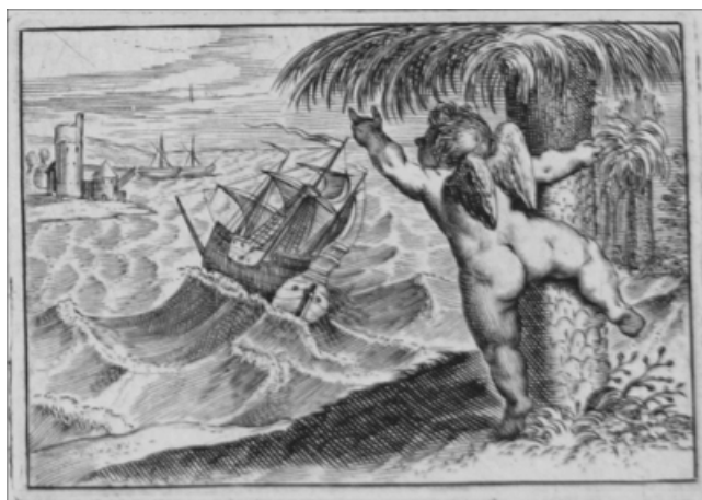
Il. 5. Emblemat z uwiecznionymi geniuszem sławy i palmą, dołączony do zbioru Otto van Veena, reprodukcja za: O van Veen, Emblemata aliquot selectiora amatoria , Amsterdam 1618, s. 34 [online]. Emblemas [dostęp: 2017-02-26]. Dostępny w Internecie: < http://emblems.let.uu.nl/static/images/va1618/pictura/OV0052.jpg >.