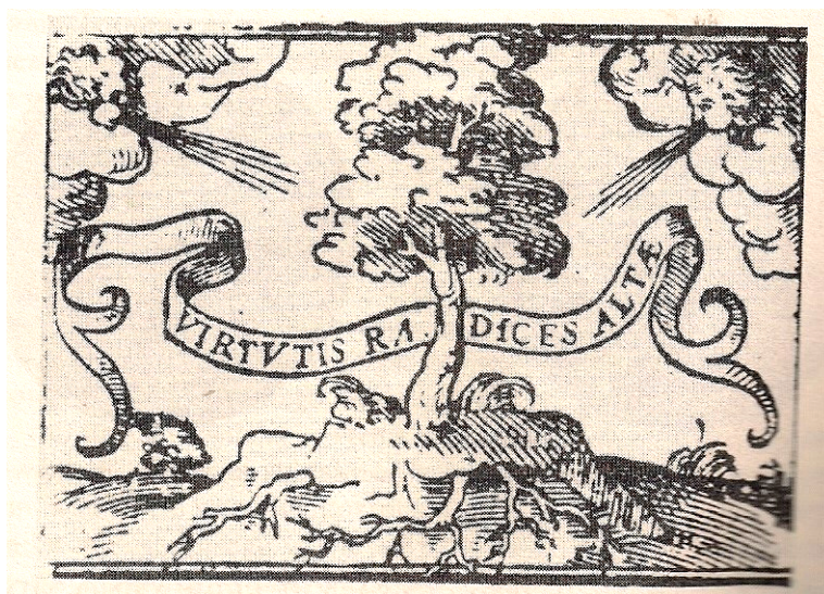
Il. 2. Emblemat przedstawiający drzewo z kategorii liściastych, upowszechniony dzięki publikacji Juana de Horozco y Covarrubia, reprodukcja za: J. Horozco y Covarrubia, Emblemas Morales de Don Iuan de Horozco Covarruias..., Saragossa, 1604, ks. 2, s. 29 [online]. Hathi Trust [dostęp: 2017-02-26]. Dostępny w Internecie: < https://babel.hathitrust.org/cgi/pt?id=uiuo.ark:/13960/t7vm4wp98;view=1up;seq=291 >.