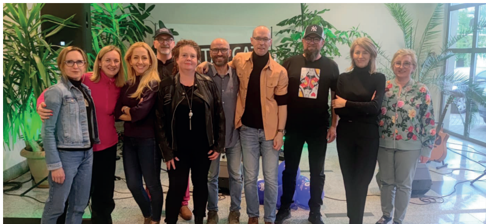
Il. 8. XXVI Poznański Festiwal Nauki i Sztuki, koncert zespołu Mental Cat – Maanam akustycznie, IKE UAM