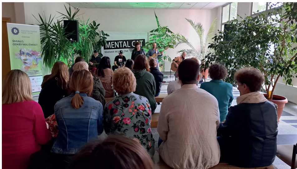
Il. 7. XXVI Poznański Festiwal Nauki i Sztuki, koncert zespołu Mental Cat – Maanam akustycznie, IKE UAM