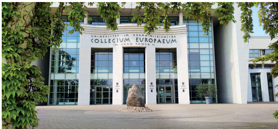
Il. 14. Budynek Collegium Europaeum. Architektura zewnętrzna Instytutu Kultury Europejskiej UAM w Gnieźnie