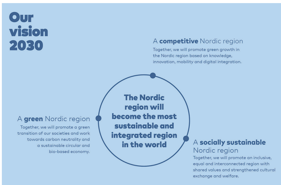
Ryc. 2. Grafika obrazująca cele w ramach Nordic Vision 2030.

W zaleceniach z 2013 r. Nordycka Rada Ministrów wypowiedziała się na temat funkcjonowania swoich biur w kontekście innych organizacji również aktywnych na tym samym terenie. Określono m.in. że współpraca Nordyckiej Rady Ministrów z Estonią, Łotwą i Litwą nie może pokrywać się z istniejącymi forami współpracy regionalnej. Jej celem jest raczej ułatwienie szerszej współpracy regionalnej i tworzenie synergii poprzez uzupełnianie i rozszerzanie istniejących sieci w regionie. Szczególny nacisk został położony na kwestie transgraniczne, które mają wpływ na kraje nordyckie i bałtyckie oraz wzmocnienie rozwoju gospodarczego i społecznego. Zaznaczono także, że planując nowe projekty, bierze się pod uwagę, czy mogą one mieć charakter panbałtycki, dlatego w miarę możliwości pamięta się o współpracy z władzami nordyckimi i bałtyckimi. 31 Również w myśl głównej wizji Nordyckiej Rady Ministrów do 2030 r. region nordycki stanie się najbardziej zrównoważonym i zintegrowanym regionem na świecie. Działania zaplanowane, opracowane i realizowane przez Biuro Nordyckiej Rady Ministrów w Estonii, Łotwie i Litwie, wspierają tę wizję.