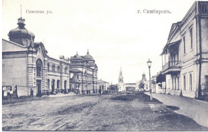
Il. 3. Symbirsk, ul. Spaska.

im bardzo daleko nie tylko do wielkomiejskiej zabudowy Warszawy czy Łodzi, ale również i zbliżonej pod względem ludności Częstochowy, która w opinii komentatorów z epoki była „prawdziwie europejskim” miastem 23 .