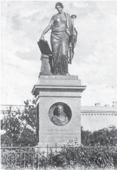
Il. 2. Pomnik Nikołaja Karamzina.