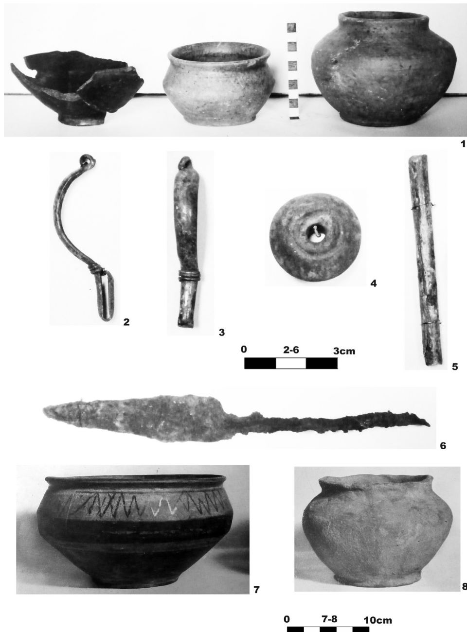
Ryc. 2. Czeladź, pow. górowski. Wyposażenie grobu 1 (1-6 wg Archiwum Państwowe, Wrocław, WSPŚ, sygn. 704, s. 69-70; 7, 8 – wg Zotz 1935, tab. XIII: 7, XIV: 3; oprac. M. Bohr)