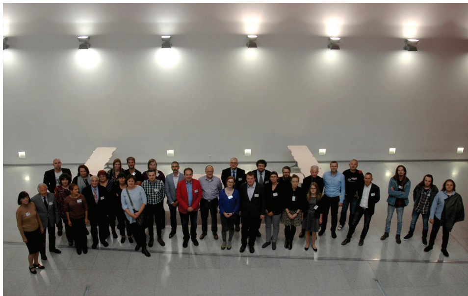
C. Uczestnicy III Warsztatów Ceramicznych. Collegium Chemicum UAM

znanie ekonomiki oraz struktury ówczesnych społeczeństw. Podczas swobodnej dyskusji, opierając się na materiale empirycznym, szukano odpowiedzi na pytanie, jakie metody badawcze w najpełniejszy sposób eksponują te jego cechy, które mogłyby zostać uznane za niezależne czynniki definiujące odmienności, mogące stać się podstawą dla weryfikacji stosowanych aktualnie podziałów kulturowo-chronologicznych społeczności środkowoeuropejskiego Barbaricum .