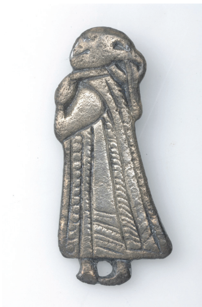
Ryc. 3. Birka, grób nr 825 – zawieszka w kształcie postaci kobiecej w długiej sukni

Wstęgi wywodzą się prawdopodobnie z długich, białych szat, które były często spinane na piersiach – noszone były w starożytnej Grecji zarówno przez mężczyzn, jak i kobiety. W Rzymie początkowo były strojem wyłącznie kobiet. Zwyczaj noszenia wstęgi (głównie purpurowej barwy) jako ozdoby togi i symbolu znaczenia/rangi przyjęli z czasem cesarscy urzędnicy. Cesarze obdarowywali nimi znaczących urzędników. Chrześcijanie nadali wstędze charakter liturgiczny, dziś znany jako stula (por. Konieczny, 2013, s. 1094).