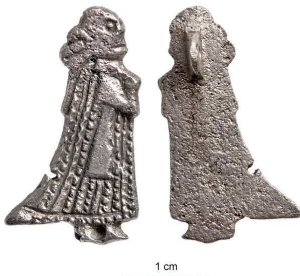
Ryc. 1. Janów Pomorski/Truso – zawieszka w kształcie postaci kobiecej w długiej sukni. Srebro. Wysokość 2,7 cm, waga 2,64 g, nr inw. 1578/2008