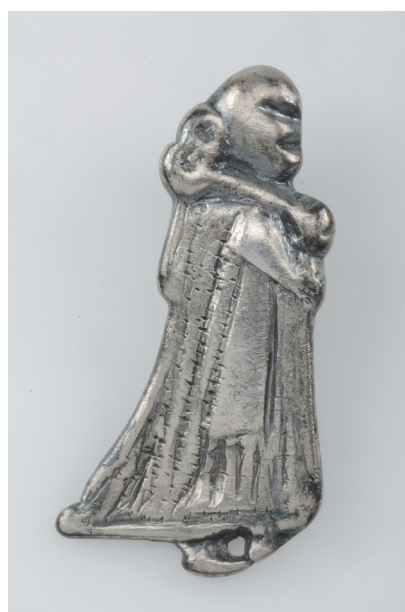
Ryc. 2. Birka, grób nr 968 – zawieszka w kształcie postaci kobiecej w długiej sukni