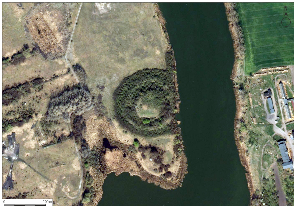
Ryc. 1. Grodzisko Szarlej w Ostrowie Krzyckim – położenie na tle współczesnego ukształtowania terenu. Ortofotomapa z serwisu mapy.geoportal.gov.pl