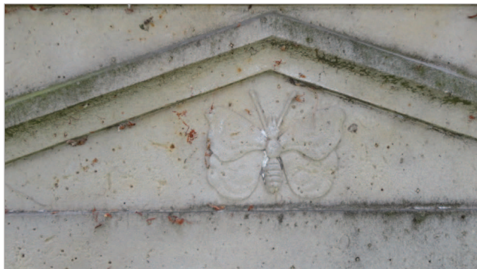
Fot. 5. Motyl – symbol krótkiego życia ludzkiego w wymiarze wieczności (ze zbioru w posiadaniu J.P.)