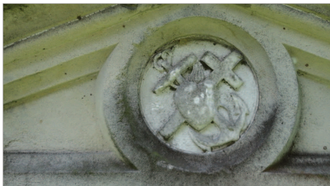
Fot. 7. Serce – symbol miłości i wiary (tu w połączeniu z symbolami krzyża i kotwicy)