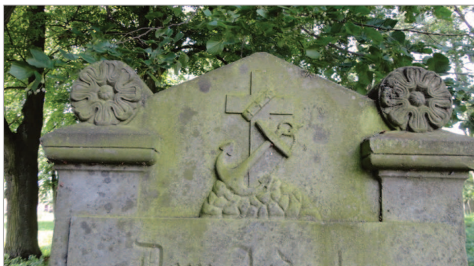
Fot. 4. Kotwica w połączeniu z krzyżem – symbol nadziei na zmartwychwstanie (ze zbioru w posiadaniu J.P.)