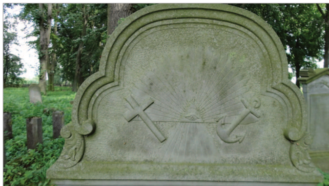
Fot. 6. Oko opatrności – symbol Boga Ojca (tu w połączeniu z symbolami krzyża i kotwicy)