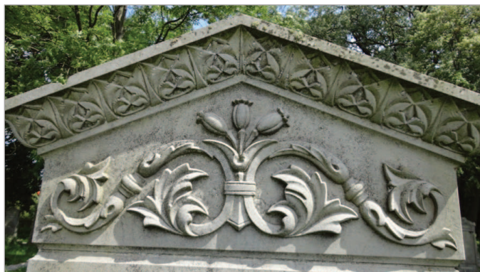
Fot. 2. Pęk makówek – symbol wiecznego snu (ze zbioru w posiadaniu J.P.)

Poniżej przedstawiamy serię fotografii z widocznymi symbolami umieszczanymi na cmentarnych stellach na cmentarzu mennonickim w Stogach Malborskich: