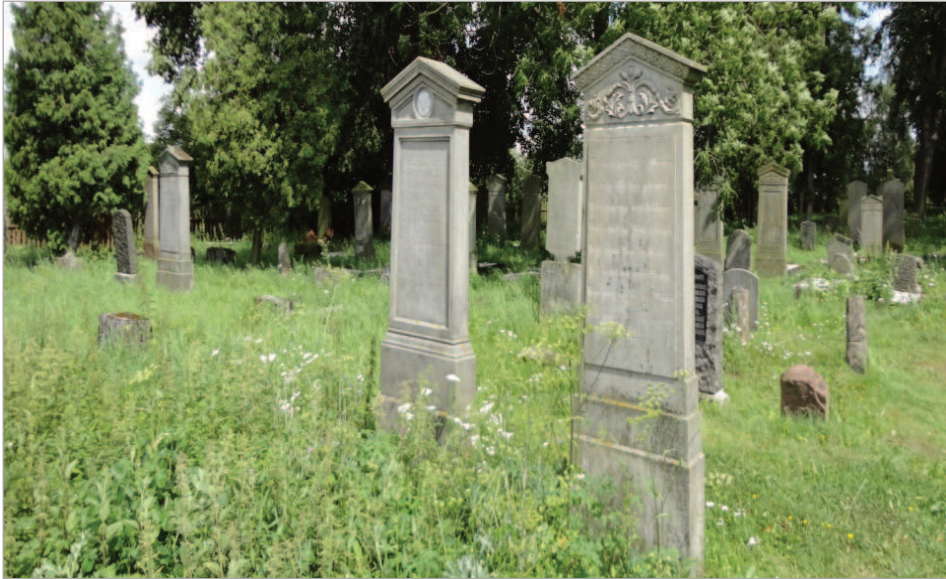
Fot. 1. Widok cmentarza Menonitów w Stogach Malborskich

zachował się również jeden nagrobek typu cippus (nagrobek w kształcie prostopadłościanu zwieńczony zazwyczaj wazą lub urną). Wszystkie nagrobki prezentują formy rokokowe, klasycystyczne, jak i eklektyczne. Jak widać na Fot. 1 stele były wykonane z piaskowca i były wysokie (sięgały niekiedy 2,5 m wysokości). Wszystkie stele wykończone były tympanonami, na których umieszczano określony symbol (patrz Fot. 2–7). Niezmiernie ciekawym i oryginalnym elementem cmentarza mennonickiego jest właśnie symbolika sepulkralna, która jest niezwykle bogata. Choć spotykane na nich motywy ikoniczne mają uniwersalne znaczenie, to jednak próżno szukać podobnych na nagrobkach innych religii, np. na cmentarzach katolickich.