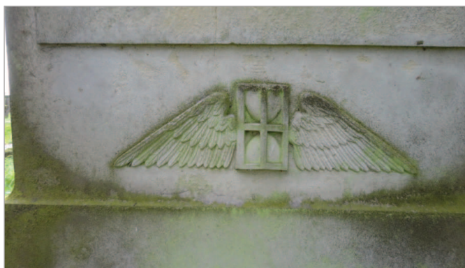
Fot. 3. Uskrzydłona klepsydra – symbol czasu i wieczności (ze zbioru w posiadaniu J.P.)