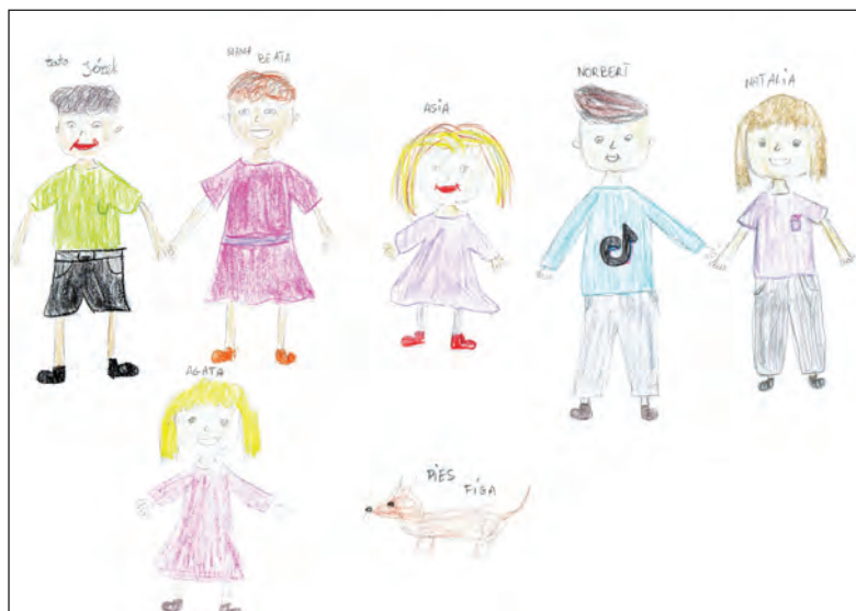
Ilustracja 2. Sara – 9 lat