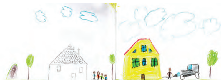
Ilustracja 5. Karol – 7 lat