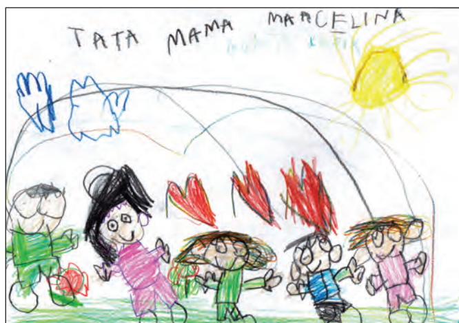
Ilustracja 3. Karolina – 6 lat

Obrazek powstały na potrzeby badania zaskoczył matkę nr 3 pod względem wykonania, ponieważ córka narysowała postać tak, jak uczy ją matka. Matka nr 3