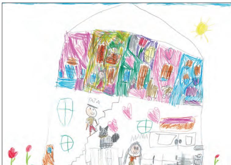
Ilustracja 7. Paulina – 6 lat