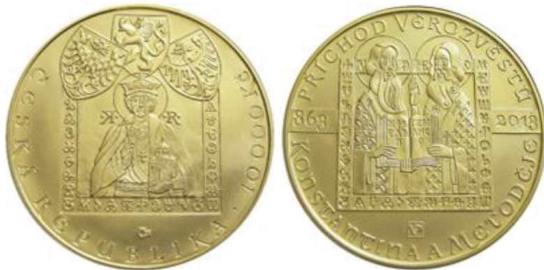
Il. 4. Moneta o nominale 10 000 korun českých (złoto 999,9) 31,107 g, 34 mm, 2013 rok

wielkomorawskiego (...) i stał się wzorem dla państw konstytuujących się w X wieku w Europie Środkowej” 24 .