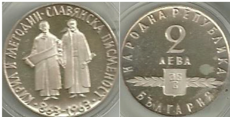
Il. 5. Moneta o nominale 2 lewów bułgarskich (srebro 900/1000), 8,89 g, 24 mm, 1965 rok

alfabetu cyrylicy, od których w obie strony odchodzi prostopadle ornament roślinny (dzieła Braci jako korzeń rozwijającej się kultury bułgarskiej), w otoku monety umieszczona została nazwa państwa „НАРОДНА РЕПУБЛИКА БЪЛГАРИЯ”. Niewiele więcej elementów zawierają rewersy, w których centrum znajdują się wizerunki Braci Sołuńskich, z lewej strony św. Cyryla trzymającego w rękę zwój pergaminu, z prawej św. Metodego. Obaj pozbawieni są jakichkolwiek oznak świętości (aureoli) oraz atrybutów czy też elementów stroju, które wskazywałyby na ich związek z religią. Zamiast szat kapłańskich lub mniszych ubrani zostali w stroje świeckie – długą, sięgającą kostek szatę spodnią (u Metodego przepasaną szerokim pasem) oraz niewiele krótszy wierzchni kaftan. Strój wydaje się odnosić do męskiej mody pierwszej połowy XIX wieku i przypominać ubiór np. Zacharego Zografa w fresku z cerkwi św. Nikoły w monasterze Baczkowskim. Tym samym wczesnośredniowiecznym świętym nałożono maskę bułgarskich twórców literatury i sztuki okresu budzenia świadomości historycznej i tworzenia kultury oraz tożsamości narodowej. Umieszczony w otoku podpis „КИРИЛ И МЕТОДИИ • СЛАВЯНСКА ПИСМЕНОСТ” oraz daty „863–1963” dodatkowo podkreślają wyłącznie świecki charakter twórców słowiańskiego piśmiennictwa i tym samym świętowanego jubileuszu wprzęgniętego w program ideowo-kulturowy ateistycznego państwa.