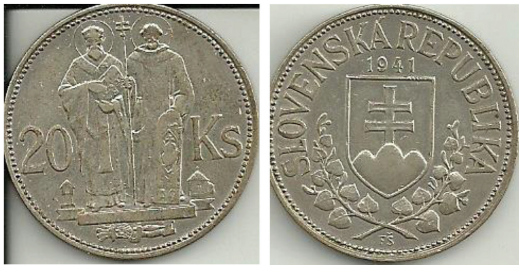
Il. 1. Moneta o nominale 20 koron słowackich (srebro 500/100), 16 g, 31 mm, 1941 rok 12