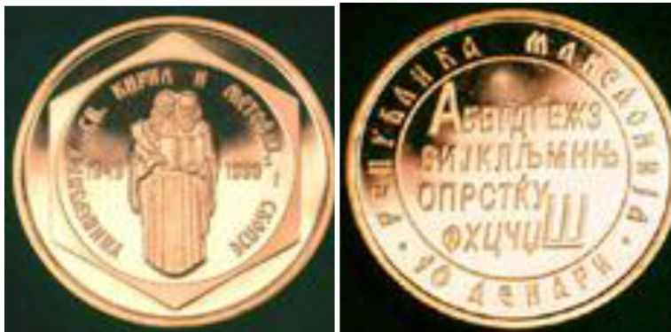
Il. 6. Moneta o nominalie 10 denarów macedońskich (złoto 916/1000), 7 g, 23 mm, 1999 rok

i pióro (logo Uniwersytetu w Skopje), po obu stronach znajdują się daty „1949” i „1999” oraz napis „УНИВЕРЗИТЕТОТ „СВ. КИРИЛ И МЕТОДИЈ“ – СКОПЈЕ” 39 .