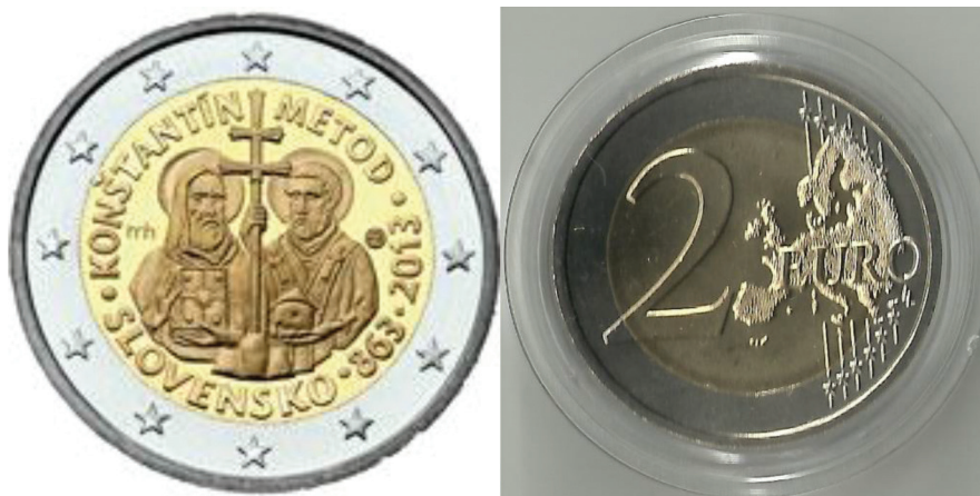
Il. 3. Słowackie 2 euro, 8,50 g, 25,75 mm, 2013 rok

Moneta o standardowej dla wszystkich państw strefy euro średnicy 25,75 milimetrów i ciężarze 8,50 gramów, składa się z miedzioniklowego pierścienia zewnętrznego oraz trzywarstwowego (CuZn20Ni5/Ni12/CuZn20Ni5) rdzenia wewnętrznego, a wybita została w liczbie jednego miliona egzemplarzy.