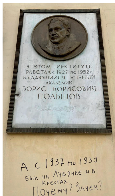
Рис. 4. Мемориальная доска академику Борису Полюнову (Пыжевский переулок, дом 7)

Ресурсы: „Novaâ gazeta”. Web. 01.05.2023. https://novayagazeta.ru/articles/2020/10/29/87755-a-chto-s-nim-sluchilos-v-1937-m .