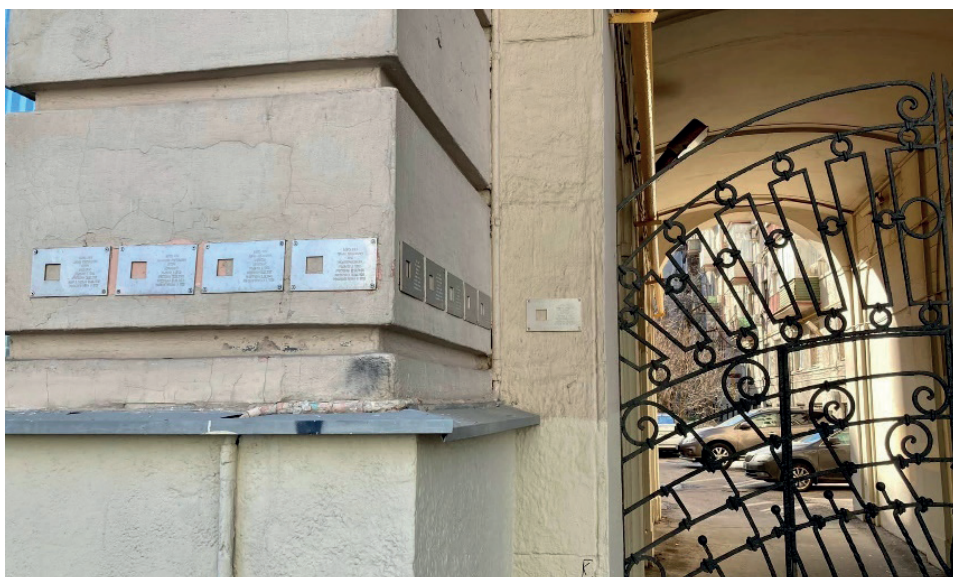
Рис. 6. „Последний адрес”: памятные знаки (Москва, ул. Долгоруковская, д. 5)