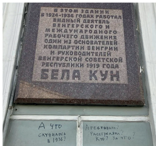
Рис. 3. Мемориальная доска Беле Куну, деятелю венгерского и международного коммунистического движения (ул. Воздвиженка, дом 1)

Ресурсы: „Novaâ gazeta”. Web. 01.05.2023. https://novayagazeta.ru/articles/2020/10/29/87755-a-chto-s-nim-sluchilos-v-1937-m .