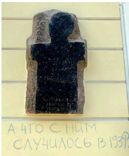
Рис. 1. Мемориальная доска поэту Осипу Мандельштаму (Тверской бульвар, дом 25)